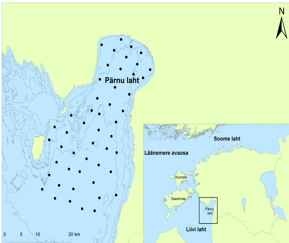
Joonis 1. Pärnu lahe skeem koos proovide kogumise jaamadega

mil veevahetus Liivi lahega on suurim, pinnavee soolsus tõuseb ning jääb seejärel kuni jää tekkeni enam-vähem keskmisele tasemele.