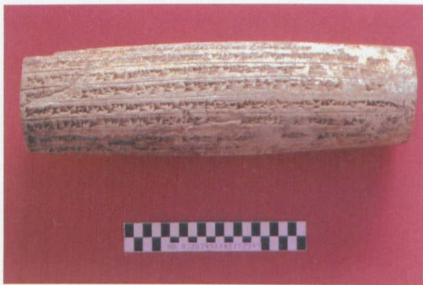
Abb. 5: Mittelassyrischer Gründungszylinder des Aššur-ketti-lešer.

Auf der Nordkuppe wurde ein ausgedehntes Wohnhaus freigelegt, welches an einen öffentlichen Platz angrenzt. Das Haus ist in additiver Bauweise während mehrerer Phasen errichtet worden und besteht aus einer zweifach abknickenden Raumkette. In einem kleinen Innenhof ist ein Rundspeicher auf einem massiven Steinfundament errichtet worden. Zu den