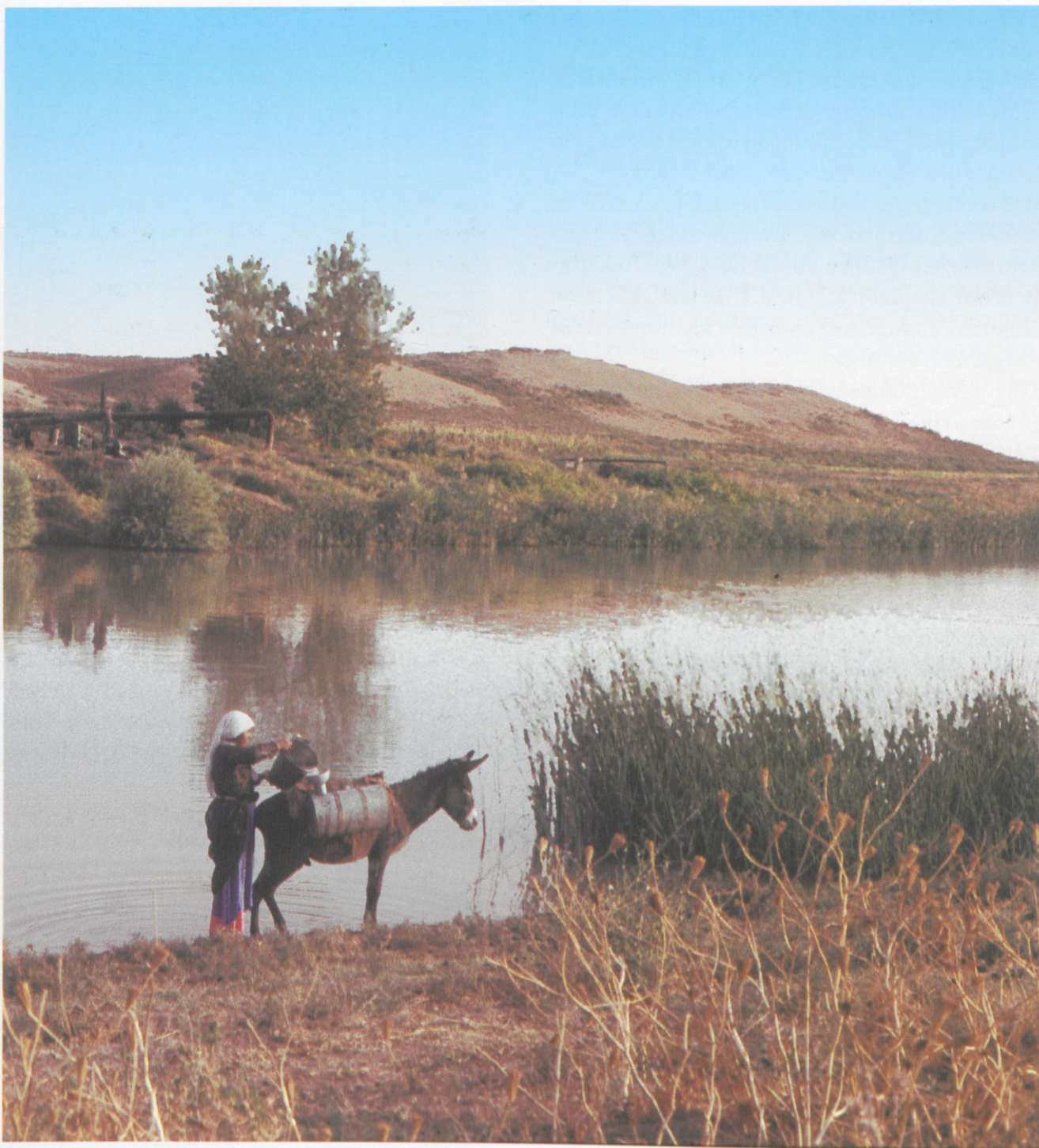
Abb. 1: Der Håbr mit Tall Bderi.