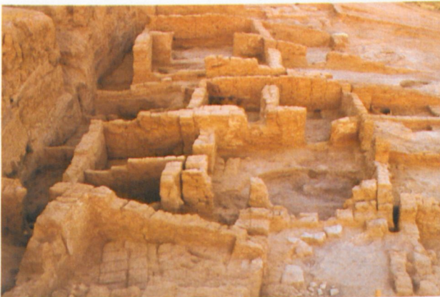
Abb. 3: Blick auf die frühbronzezeitliche Wohnbebauung der Schicht 9.

Auf der Nordkuppe des Tall Bderi liegt eine Abfolge von der Periode Früh-Jazira III A zu III B vor. Auch hier ist die Siedlung der Früh-Jazira III B-Zeit abrupt zerstört worden, was v. a. am Zerstörungsinventar des Raumes A deutlich wird. Es enthielt zahlreiche Keramikgefäße, Steingeräte, Getreidereste u. a., so daß die häuslichen Aktivitäten der Nahrungsproduktion auch hier detailliert rekonstruiert und lokalisiert werden können.