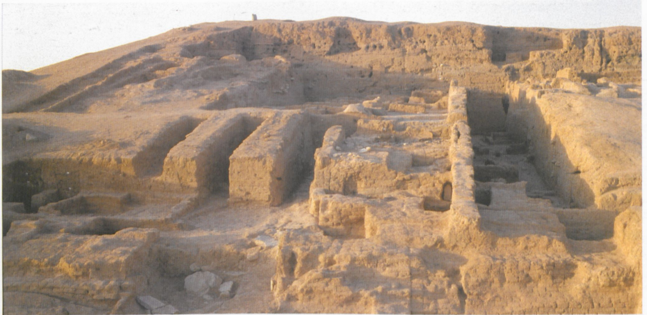
Abb. 2: Die Grabungsstelle am Südhang des Tall Bderi mit Hangschnitt und Stadtmauer.

kontinuierliche Entwicklung einer Kleinstadt intra muros . Auch das sich von einer kurzen Straße auf der Innenseite des Stadtttores aus verzweigende Gassensystem mit einer Rundstraße entlang der Stadtmauer wurde seit dieser Zeit unverändert beibehalten (Abb. 2). Schon von der Früh-Jazira II-Zeit an drängten sich die kleinformatischen Häuser eng innerhalb des Stadtgeländes zusammen.