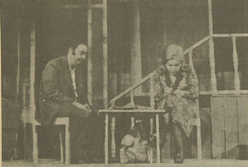
Oktay Rifat'ın diğer bir oyunu Atlarla Filler (Dirlik Düzenlik) 'i Devlet Tiyatroları 1977'de sahnelenmişti

İnci ile Arif'in birbirinden uzak, birbirine yabancı dünyaları