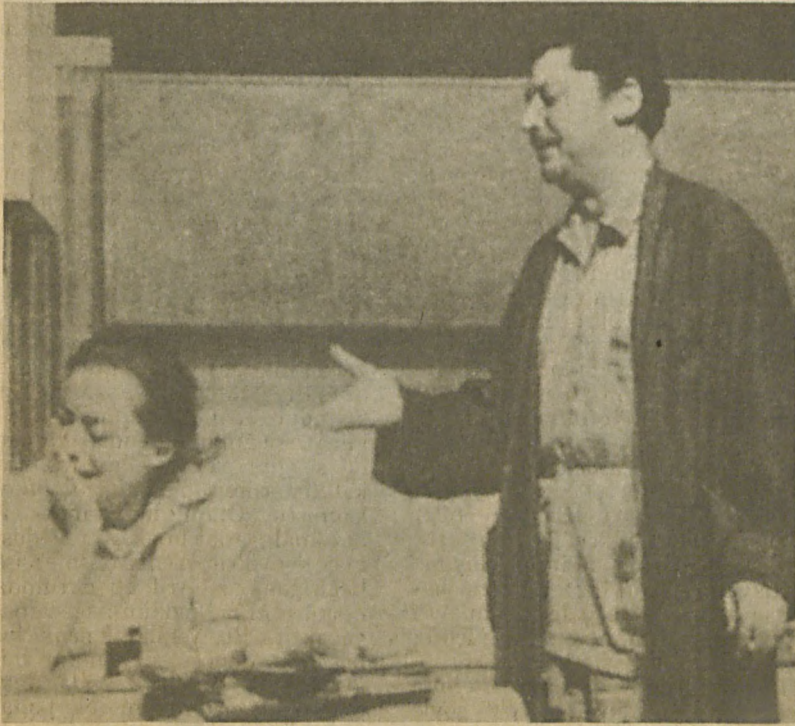
"Yağmur Sıkıntısı" (Devlet Tiyatroları, 1970)

Yağmur Sıkıntısı , aynı zamanda psikolojik boyutu olan bir oyundur. Oyun kişileri karakter ayrıntıları ile tanıtılmış, ruh özellikleri ile yansıtılmıştır. Karakterlerin iç boyutu oyunun dramatik anlamını ve etkisini pekiştirecek biçimde sunulmuştur. Sahneye koyucu, ya bireyin ruhsal durumuna ağırlık verecek, dar mekânda ve sınırlı bir zaman dilimi içinde bir köşeye kısıtılmışlık durumunu vurgulayacak, bu durumun bireyi bunalıma götürmesini izlettirecek, ya da olayın toplumsal boyutunu düşündürmek üzere kişilere uzak açıdan bakılmasını, ikisini de güçlü ve güçsüz yönleri ile tanınmasını ve değerlendirilmesini sağlayacak bir düzenleme yapacaktır. Oyun salt bireysel bir dram olarak da, bir toplum gerçeğinin irdelenmesi olarak da seyirciyi etkileyecek güçtedir.