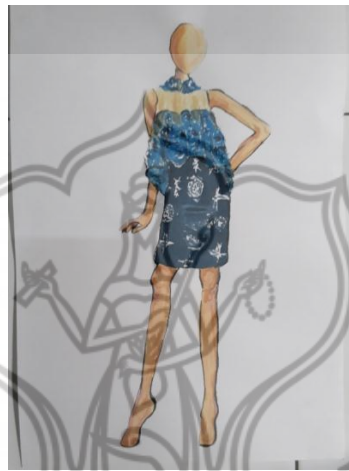
Gambar 16. Desain Busana Cocktail 4