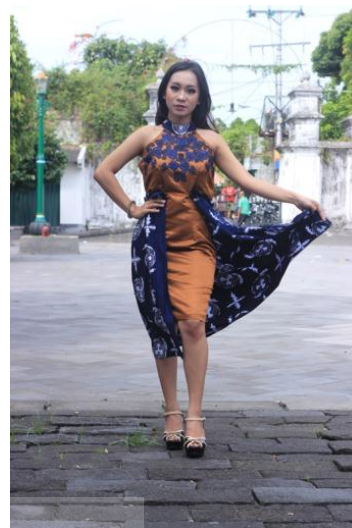
Gambar 7. Gold-plated Tomatoes 2