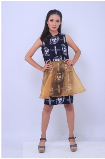
Gambar 10. Gold-plated Tomatoes 7