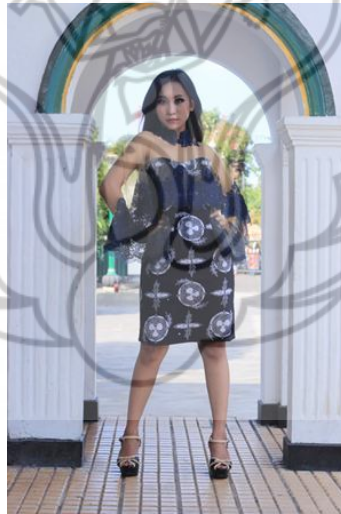
Gambar 4. Gold-plated tomatoes 4