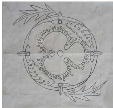
Gambar 8. Motif Batik Ceplok Ranti