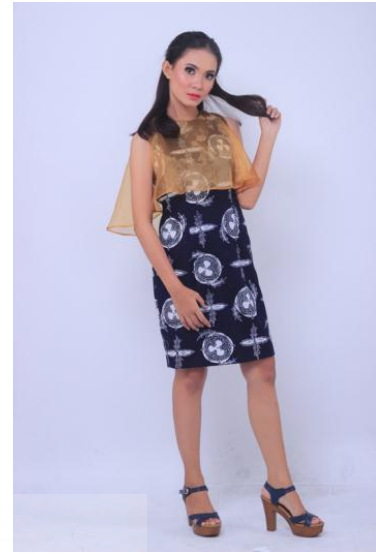
Gambar 11. Gold-plated Tomatoes