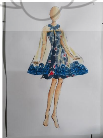
Gambar 18. Desain Busana Cocktail 5