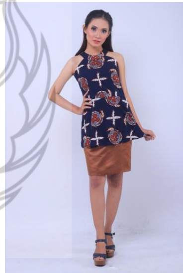
Gambar 9. Gold-plated Tomatoes 6