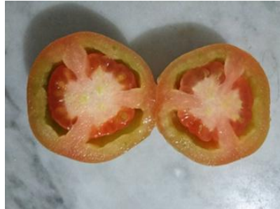
Gambar 4. Buah Tomat