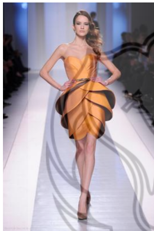
Gambar 3. Busana Cocktail