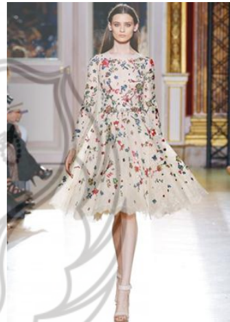
Gambar 3. Busana Cocktail