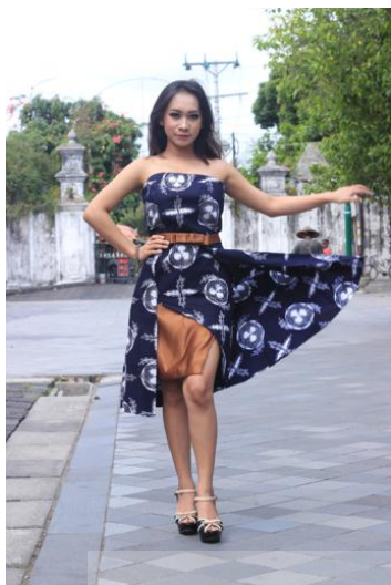
Gambar 6. Gold-plated Tomatoes 1