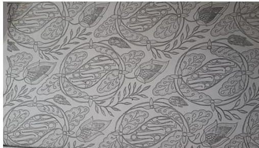
Gambar 2. Motif Batik Ceplok Paripurna

Busana pesta Cocktail adalah busana malam yang diidentifikasi oleh panjangnya, mulai dari atas lutut hingga beberapa inci di atas pergelangan kaki. Busana ini cocok untuk berbagai gaya seperti lengan pendek, lengan panjang, bahkan tanpa lengan.