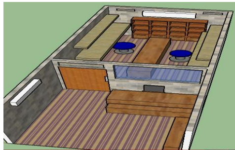
Gambar 5.1 Layout Tempat Usaha Dam'z Cleaning and Service Compute 5.3 Proses Produksi dan Gambar Teknologi