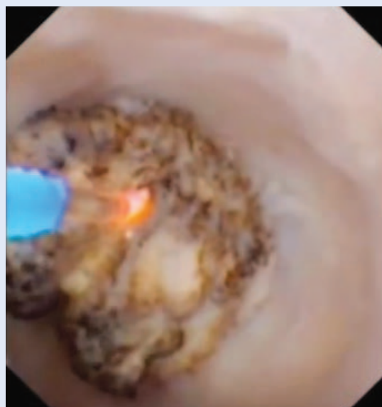
Slika 1. Litotripsija bubrežnog kamenca uz pomoć lasera

U svih pacijenata zahvat je učinjen u općoj anesteziji. U većine pacijenata najprije je retrogradnim putem postavljena ureteralna sonda u bubreg u kojemu se nalazio kamenac. Nakon toga je pacijent okrenut u pronacijski položaj, a poseban jastuk stavljen je tako da izboči lumbalnu regiju. Retrogradnim putem je aplicirano kontrastno sredstvo i metilensko plavilo te je učinjena ultrazvučno vođena punkcija donje skupine čašice bubrega. Nakon što je kontrastnom snimkom potvrđeno da je punktirana adekvatna bubrežna čašica, postavljena je u kanalni sustav hidrofilna žica vodilica. Učinjena je incizija kože duljine do 10 mm, a potom je, uz kontrolu dijaskopije, učinjena dilatacija koristeći jedan, metalni, konusni dilatator. Nakon toga je kroz njega postavljena sigurnosna žica vodilica. Preko dilatatora je postavljen odgovarajući metalni Amplatzomotač nefroskopa (Karl Storz, Tuttlingen, Njemačka) promjera 15/16 Ch. Dilatacija i postavljanje omotača učinjeni su pod dijaskopskom kontrolom. Mininefroskop (vanjski promjer instrumenta 12 Ch s 6,7 Ch radnim kanalom) (Karl Storz, Tuttlingen, Njemačka) je uveden kroz omo-