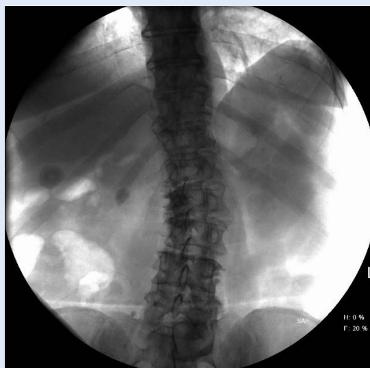
Slika 2. Kamenac u pijelonu desnog bubrega

Od 1. kolovoza 2015. godine do 31. prosinca 2016. godine u našem centru šest pacijenata operirano je metodom miniPCNL-a. Među njima su bile tri žene, a prosječna dob bila je 50,5 godina (raspon 28 – 76 godina). Indeks tjelesne težine bio je od 24,2 – 30,5. U svih pacijenata kamenac je bio u desnom bubregu, od čega u 5 njih u pijelonu, a kod jednog pacijenta u donjoj skupini čašica. Veličina konkrementa kretala se od 13 × 8 mm do 24 × 20 mm (slika 2). U jednog pacijenta kamenac je bio u transplantiranom bubregu. Laserska litotripsija uspješno je učinjena u svih pacijenata te na kontrolnoj RTG snimci mjesec dana nakon operacije nije bilo ostatnih fragmenata. Sama operacija trajala je između 120 i 210 minuta s time da je prva operacije trajala najdulje, a kasnije se duljina operacije smanjivala. U troje pacijenata kamenac je