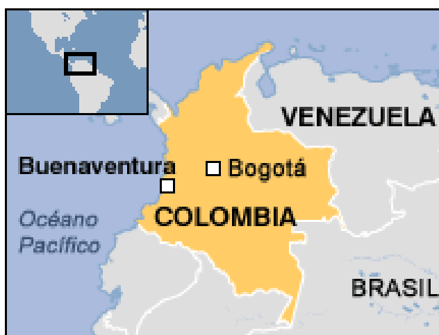
Mapa 1. Ubicación geográfica del municipio de Buenaventura en Colombia.