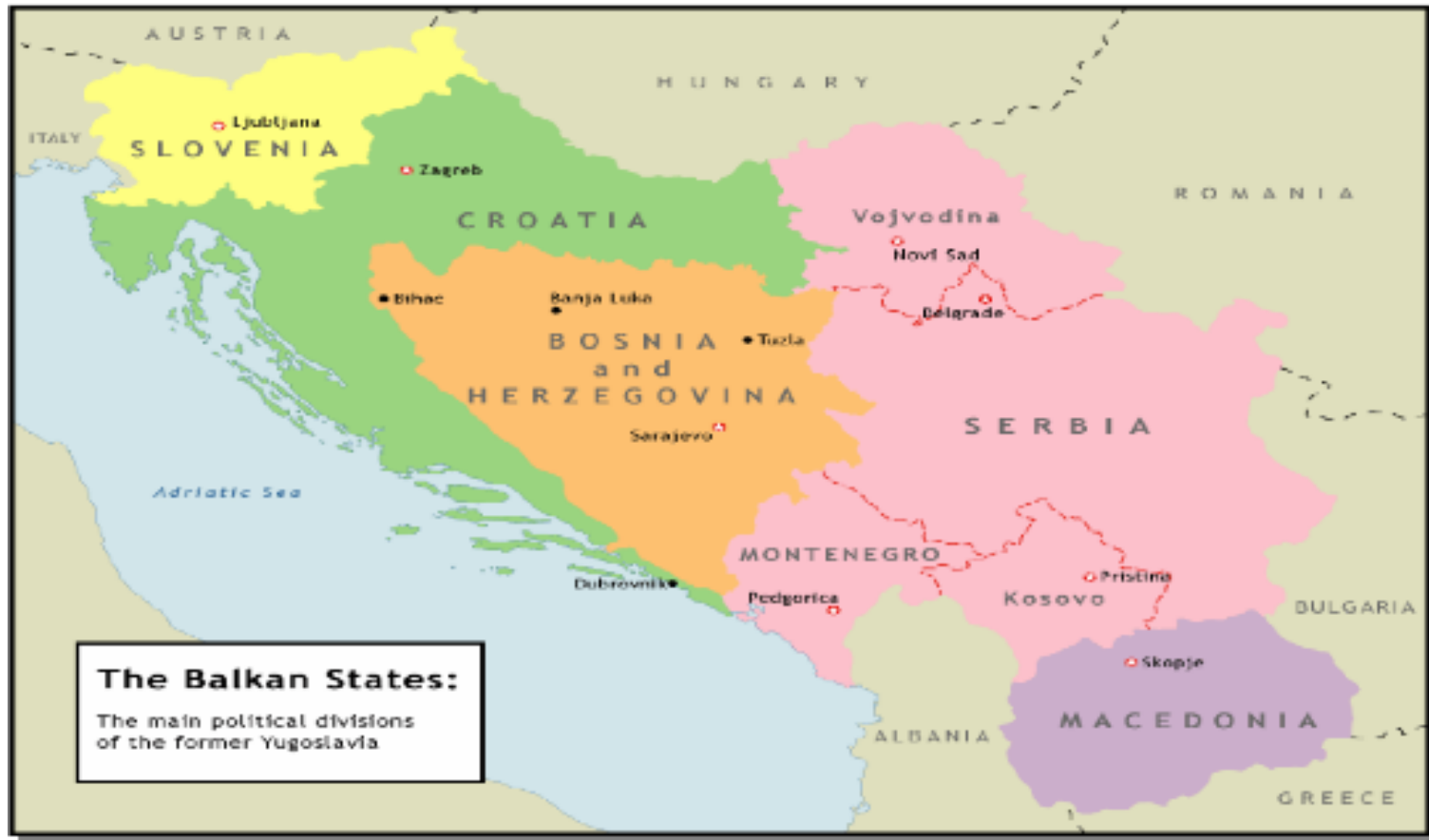
Anexo 1. Mapa. División política de la Ex República Federal Socialista de Yugoslavia

Fuente: Center for European Studies. "What Happened to Yugoslavia? The War, The Peace and the Future", 2004. p. 2. Documento electrónico.