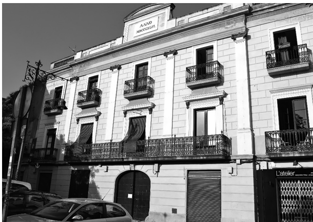
Casal dels Sala a la Plaça Gran de Mataró