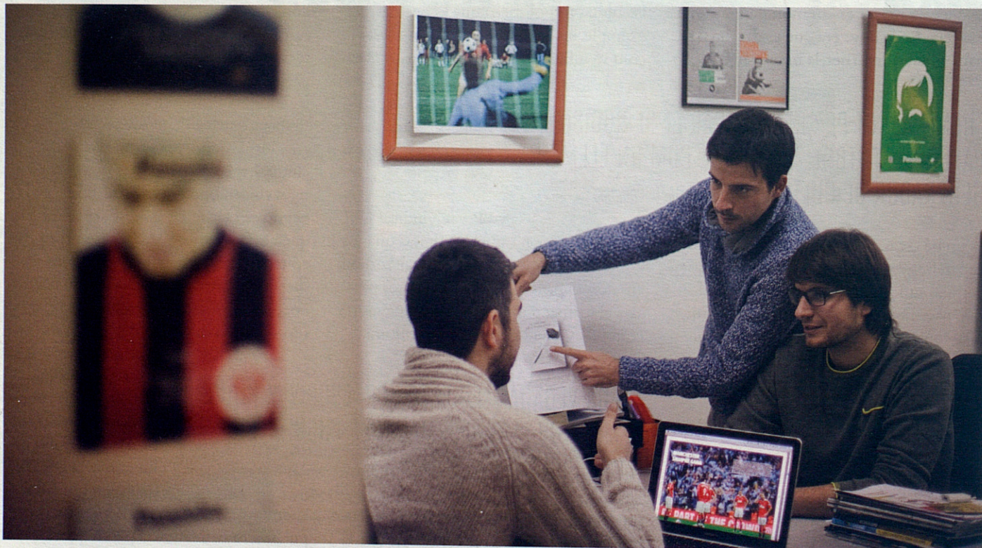
Tres dels membres de l'equip de Panenka , publicació de culte per als amants de tot el que envolta el món del futbol.

Respecte al futur, no hi ha res clar. Les editorials acostumen a ser petites, creades pels mateixos periodistes amb capitals mínims i, per sobreviure, depenen de les vendes de cada exemplar: "No hi ha un model clar de negoci -explica Àngel L. Fernández- a una publicació que funciona li surt competència, hauran de repartir els ingressos i es mantindrà qui pugui. Crec que sempre serà una lluita de mínims".