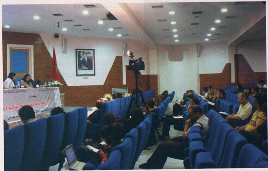
De dalt a baix, imatge de la recepció i acreditació (foto: Fabiola Calvo), foto de grup de les diferents delegacions (foto: Laia Serra) i, a baix, Auditori de la facultat de Medicina de la Universitat Sidi Mohamed Ben Abdellah, on es va celebrar la Trobada (foto: Laia Serra).