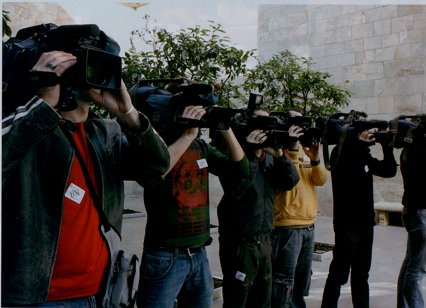
Càmeres al Pati dels Tarongers. En la pàgina posterior, la sala on es dona el senyal del Parlament.

vegada prolifera més”, assegura Rafael Carballo, membre del departament de producció dels informatius de Cuatro. Les darreres campanyes polítiques de CiU, PSC i PPC, les reunions setmanals del PSOE i el PP a Madrid, els actes de la Casa Reial, les sessions de vuit dels disset parlaments autonòmics o diferents rodes de premsa d'empreses com Endesa, Sony, Nike o Warner intenten limitar el marge de maniobra dels equips. I aconsegueixen que es treballi amb les imatges que ells mateixos proporcionen.