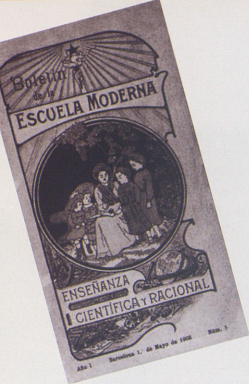
Portada del primer butlletí del Boletín de la Escuela Moderna

seva “fundada convicció” en la culpabilitat del processat, va insistir en la idea que a la Casa del Poble de Barcelona “els diners havien circulat abundantment”, va demanar el mateix dia 13 d’octubre “que la justícia fos implacable respecte a Ferrer” i, fins i tot després de l’execució, va continuar obrint durant diverses setmanes la primera pàgina de tipografia amb un interminable llistat d’adhesions a la seva campanya de suport al Govern i en contra de la protesta estrangera per l’afusellament.