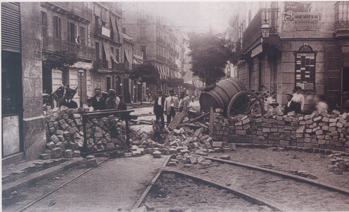
Una de les moltes barricades que es van aixecar per tot Barcelona durant els dies de la Setmana Tràgica

contingut d'articles periodístics, en què se l'acusava sense cap base incriminàtoria; decisives les proclames manipulades que es van publicar violant el secret del sumari; i concloents les al·lusions de l'assessor militar i l'auditor de guerra, que es van servir de simples retalls de premsa per formular bona part de les proves de càrrec.