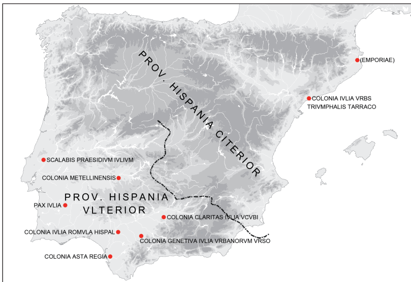
Fig. 2. Fundaciones de época cesarea. IAA de Madrid (E. Puch Ramírez).

Para responder a la segunda cuestión planteada, abrimos un paréntesis para exponer la situación de las ciudades, que no colonias, en el valle del Ebro en el siglo II a.C. tardío y principios del siglo I a.C. Analizándolas, F. Pina Polo observó una cierta regularidad en la fundación de nuevas ciudades romanas a no mucha distancia, de 4 a 8 km, del correspondiente poblado indígena. Destacan por el hecho de mantener el nombre del poblado indígena. Este autor considera que con el mantenimiento del nombre se trata de sugerir una continuidad, algo que de hecho no se da, ya que se trata de fundaciones nuevas. El urbanismo está adaptado a los condicionantes del terreno, de modo que no son ciudades con sistema viario ortogonal; en esto, las fundaciones del valle del Ebro se distinguen, parcialmente, de las fundaciones de la Bética. 13 El área del valle del Ebro, mejor dicho su hinterland meseteño, vuelve a despertar nuestro interés en época cesarea ( Fig. 2 ), cuando se observa toda una serie de fundaciones nuevas y contemporáneas todas ellas, hecho que llevó a calificar dicha circunstancia de medida programada. 14