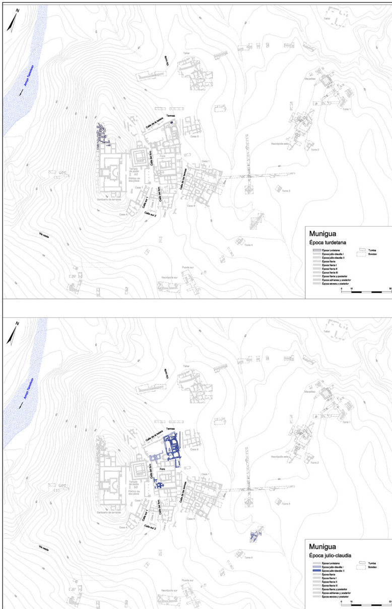
Fig. 8. Munigua. Las fases turdetana y julio-claudia. IAA de Madrid (D. Schäffler).

conocido es el de las termas de época claudia ( Fig. 8 ), 70 datadas por las monedas como terminus ante quem . 71