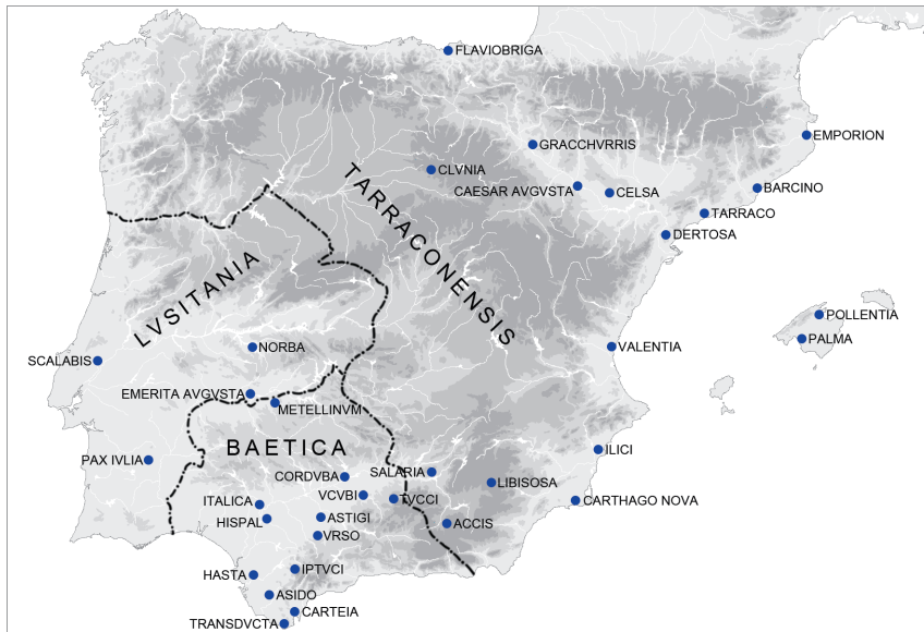
Fig. 6. Fundaciones de colonias romanas de todas las épocas. IAA de Madrid (E. Puch Ramírez).

El conjunto irregular de las fundaciones de colonias romanas en la Península Ibérica ( Fig. 6 ) se explica por las descripciones, como hemos visto. Si cambiamos el enfoque e incluimos también los municipios, la conclusión es parecida. Así, en algunas regiones, como en la Bética, las ciudades y los asentamientos se acumulan, mientras que en otras regiones, como en la Meseta Central hispana, faltan por completo las ciudades en amplias áreas. En un país que debido a su extensión, con más de 1.000 km en cada dirección, constituye un verdadero subcontinente europeo, esta colonización irregular y no equilibrada resulta tanto más sorprendente.