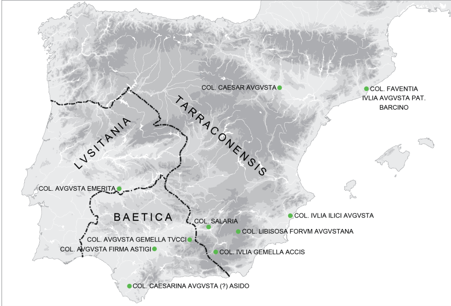
Fig. 4. Fundaciones de época augustea. IAA de Madrid (E. Puch Ramírez).

esquema jerarquizado de estas ciudades situadas en torno a una capital, en este caso Pax Iulia /Beja, en función de la cual existen; en ello hay que reconocer un elemento típicamente hispánico del que se carece en Italia. 19