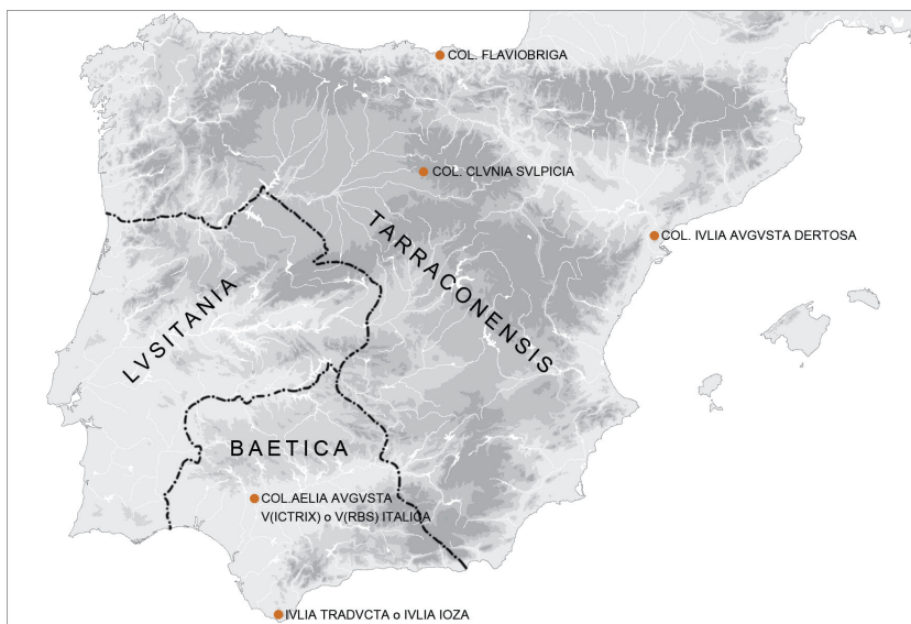
Fig. 5. Fundaciones de época postaugustea. IAA de Madrid (E. Puch Ramírez).