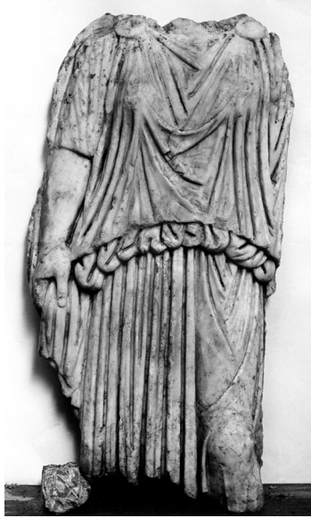
Fig. 7. Mérida. Cariátide del Foro de mármol de la c/ Sagasta, actualmente fechada en época flavia. Inst.-Neg. IAA Madrid R 23-86-11 Foto (P. Witte).

años (25-30 d.C.). 56 La gran diferencia de los periodos de construcción es llamativa y permite extraer conclusiones. Así, la razón del tiempo empleado en las correspondientes edificaciones parece derivar de la importancia de cada una de ellas. De este modo, la rapidez en la construcción del Templo de la c/Holguín se puede explicar por el hecho de que se trate de un templo dedicado al culto imperial, mientras que el Foro de mármol, al contrario de lo que se venía pensando debido a su semejanza con el Foro de Augusto en Roma, 57 parece haber sido el sitio de homenaje a las personalidades locales. 58