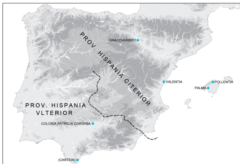
Fig. 1. Fundaciones precesareas. IAA de Madrid (E. Puch Ramírez).

vez, sino por medio de numerosas batallas extremadamente duras. 7 En consecuencia, la colonización romana se desarrolla con titubeos, con una casuística diferente en cada región y de manera desigual. No sigue ningún modelo unitario, ni en su aplicación técnica de la administración ni en su situación geográfica. Carteia , la colonia más antigua, es un caso aislado, pues con ella se acalló a los hijos nacidos de la unión de mujeres nativas con soldados romanos que reclamaban el derecho de ciudadanía íntegro bajo el derecho latino y la concesión de Carteia como hogar familiar. 8 Sólo a finales del siglo II a.C., bajo la presión de los colonos itálicos que se trasladaron a Hispania, 9 se produce una dinámica mayor que, sin embargo, sólo llega a desarrollarse plenamente tras la guerra civil entre César y Pompeyo en la época julio-claudia, dado que la mayor parte del país estaba pacificado. Al contrario de lo que hizo en Italia Central y en la Galia Cisalpina, al principio Roma actúa en Hispania sin un concepto claro, la visión a largo plazo sólo empieza a plantearse a lo largo del siglo II a.C., y a aplicarse en época cesariana, 10 como se detalla en el siguiente párrafo. Las