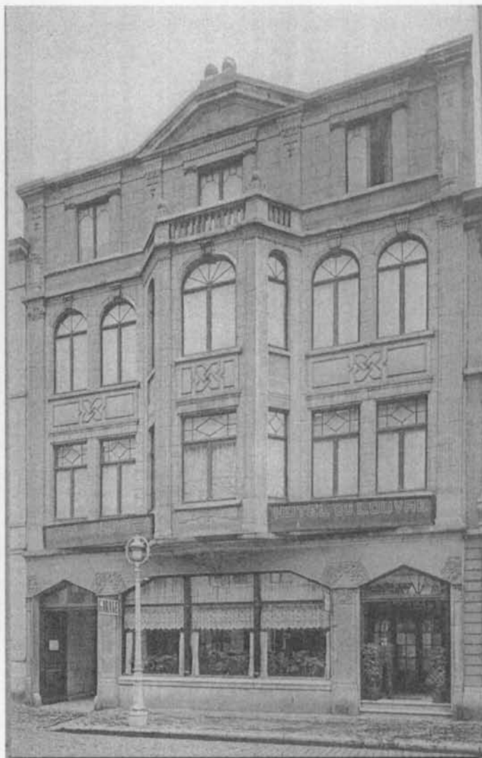
Fig. 4 : Hôtel du Louvre, vlak na zijn opening in 1933

De architect van het pand is Albert-Victor Fobert , geboren te Leupegem op 19 september 1883 (sterfdatum onbekend). Hij was één der belangrijkste en productiefste architecten van Oostende en de middenkust in het interbellum. De meeste realisaties sluiten aan bij het vooroorlogse eclecticisme, echter uitgevoerd in een meer algemene benadering zonder overdreven detaillering. Voor Oostende is hij duidelijk één der belangrijkste architecten uit het interbellum, samen met André Daniels. Diverse ontwerpen van zijn hand staan vandaag op de lijst van beschermde monumenten. Niettemin blijft Fobert een gewaardeerd architect die architectonisch een interessant parcours heeft afgelegd, gaande van klassiek en eclectisch, over Art déco invloeden, tot het modernisme (Renbaan Oostende). Zijn ontwerpen zijn vandaag belangrijke getuigenissen van de drie belangrijkste architecturale periodes in Oostende: de Belle Epoque van vóór de eerste wereldoorlog, het interbellum en het modernisme van de jaren vijftig.