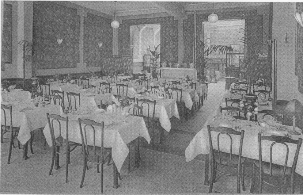
Fig. 5 : Voorste eetzaal