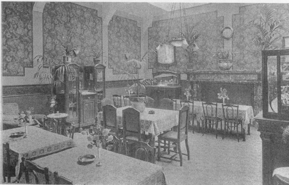
Fig. 6 : Achterste eetzaal