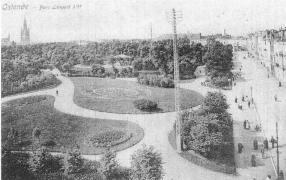
Toen het Leopoldpark nog groot was. Een zicht vanop het Postgebouw (circa 1910)

oorspronkelijk in het prieel vóór het Kursaal, “De Wind” (Bulcke) vanuit het Vuurkruisenplein, “Vier allegorische koppen” (Copers) vanuit een depot in Frankrijk, “Zeemeermin” (Kreitz) vanuit het Feestpaleis, “Ruimtelijke zelfstandigheid” (Holmens) vanaf de Albert I promenade.