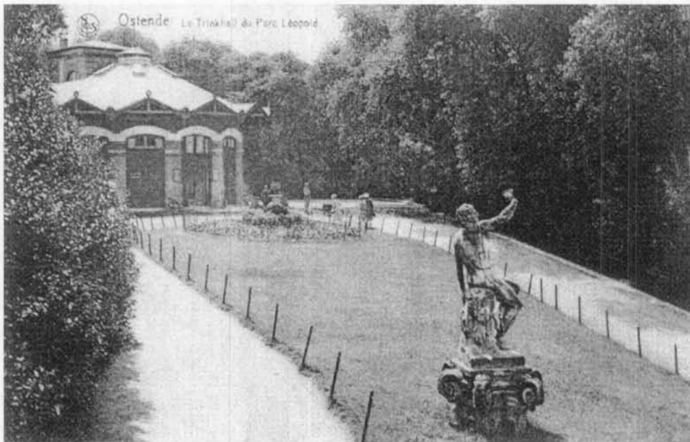
De “Trinkhall”, alwaar men mineraal water kon drinken en stortbaden nemen, werd gebouwd in 1877 en afgebroken rond 1960. Vooraan het Bacchusbeeld, de god van de wijn.