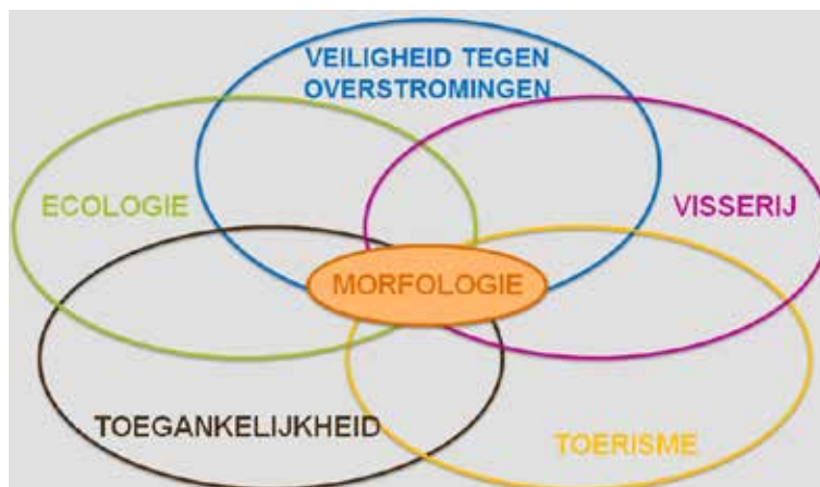
Figuur 2: Estuariene functies waarbij morfologie centraal staat (holistische benadering)

In de afgelopen jaren verschoof de focus naar een holistische benadering met aandacht voor de verschillende estuariene functies. Met die holistische benadering streeft men naar win-winsituaties, waarbij de morfologie een centrale rol speelt (Figuur 2). Voor de toekomst is het dan ook cruciaal die holistische benadering voort te zetten, waarbij het beheer van de morfologie centraal moet staan.