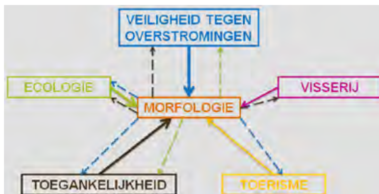
Figuur 1: Estuariene functies waarbij morfologie centraal staat ('los van elkaar'-benadering)

In het verleden werden projecten voor het Schelde-estuarium veelal los van elkaar gedefinieerd en uitgevoerd, zonder diep in te gaan op de mogelijke neveneffecten voor andere functies en diensten. Centraal in al die ontwikkelingen en menselijke ingrepen staat de morfologie van het systeem (Figuur 1).