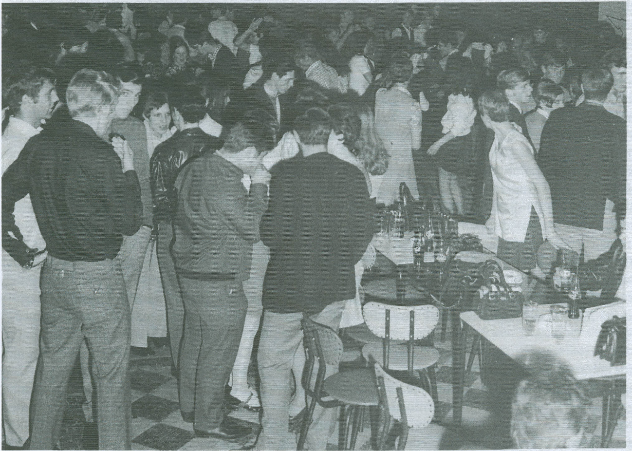
In de weekends steeds volle bak in de ontspanningszaal