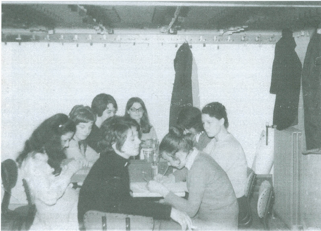
De manicure-hobbyclub kende bij de meisjes heel wat succes