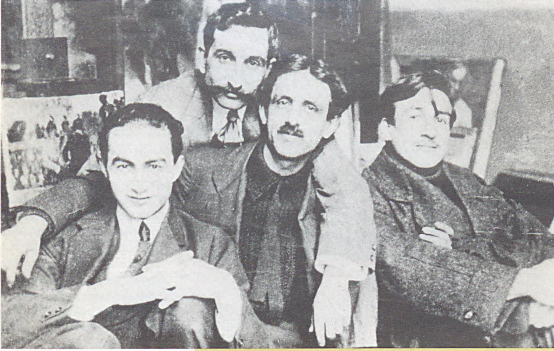
Soldan sağa doğru, Namık İsmail, Hikmet Onat, İbrahim Çallı ve Feyhaman Duran, 1914 (Adnan Çoker Arşivi).

cazibesine kapılarak aşmayı başaran ve bu başarısını resim sanatımızın onuru haline getirebilen güçlü bir kimlik olarak karşımıza çıkar. 20. yüzyılın hemen ilk yıllarında resim sanatımızın önemli ustalarına öncü olmayı başaran bu genç ressam, öğretisinde yetişen gençler için de bir 'efsane' olacaktır. Eşref Üren'in de belirttiği gibi: