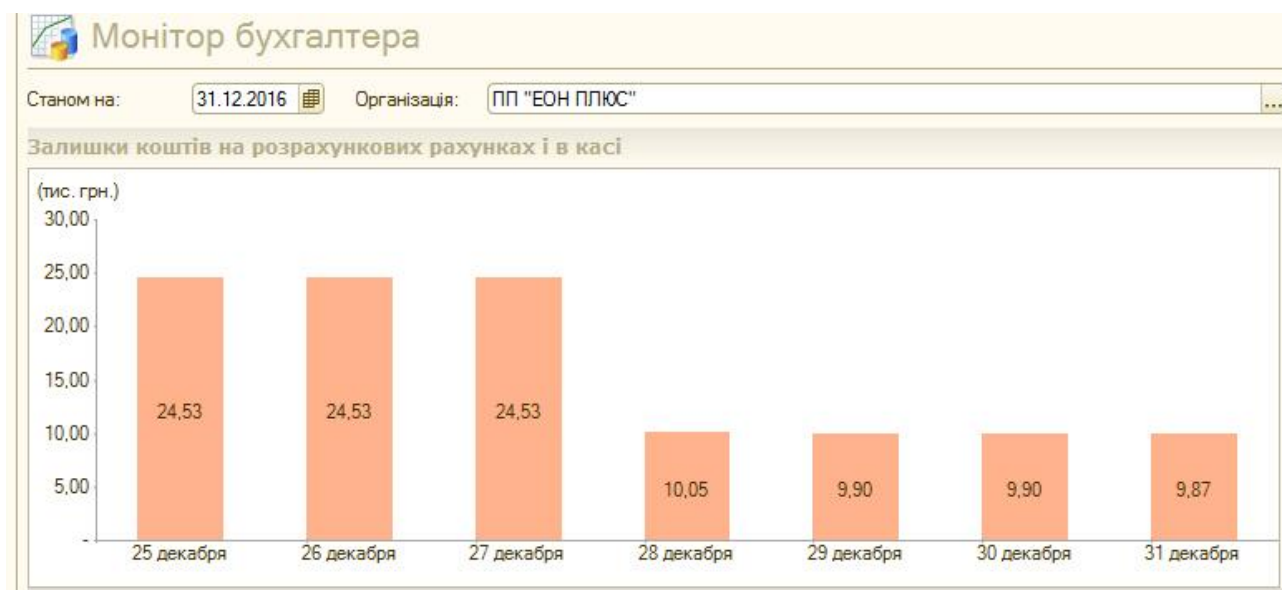
Рис. 1. Залишки коштів на розрахункових рахунках і в касі у вкладці «Монітор»

пропонується розбити загальний стовпець окремо на касу підприємства і окремо на розрахункові рахунки підприємства.