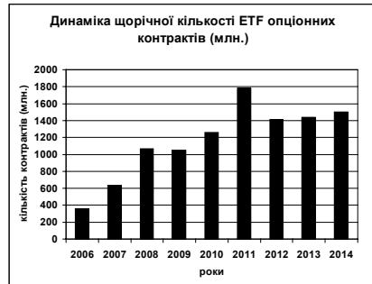
Рис. 2. Щорічна кількість опціонних контрактів біржових інвестиційних фондів, млн

У зв'язку з продовженням активного розвитку ринку ПФІ після кризи були вдосконалені основні пруденційні принципи для фінансових установ з метою покращення наглядової практики і управління ризиками, а саме: підвищення якості і скорочення періодичності проведення нагляду фінансових установ з наданням адекватних повноважень для ефективної боротьби з системними установами; застосування загальносистемного, макропруденційного нагляду з метою своєчасної ідентифікації, аналізу і прийняття попереджувальних рішень у напрямку запобігання підвищення системних ризиків; імплементація ефективних антикризових інститутів і мір щодо виявлення динаміки ймовірності дефолту фінансових установ.