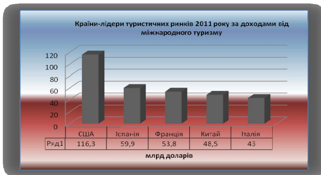
Рис.2 Країни-лідери туристичних ринків за доходами від міжнародного туризму в 2011 р. [10],[6]

Наявні природні умови, добре розвинуті транспортні шляхи, а також достатня матеріально-технічна база туризму – усе це сприяє постійно високому інтересу туристів до цієї країни. Тому не дивно, що сьогодні туристичний ринок Китаю входить до числа країн-лідерів за доходами від міжнародного туризму (рис2).