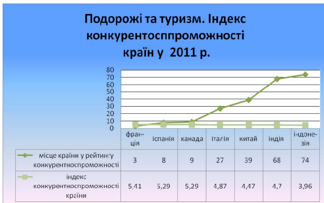
Рис.1. Індекс конкурентоспроможності країн 2011р. [12]

Наявні природні умови, добре розвинуті транспортні шляхи, а також достатня матеріально-технічна база туризму – усе це сприяє постійно високому інтересу туристів до цієї країни. Тому не дивно, що сьогодні туристичний ринок Китаю входить до числа країн-лідерів за доходами від міжнародного туризму (рис2).