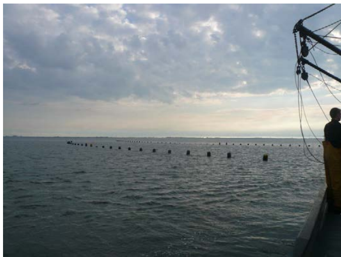
Fig. 6. Twee longlines voor off-bottom cultuur van oesters.