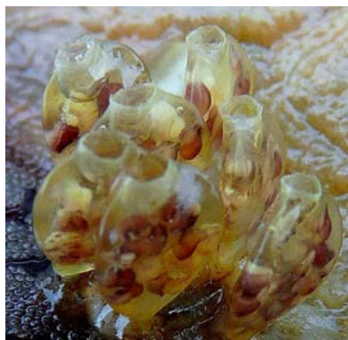
Fig 2. Urosalpinx cinerea. Rechts: ei capsules met jonge slakjes nabij Gorishoek, The Netherlands.