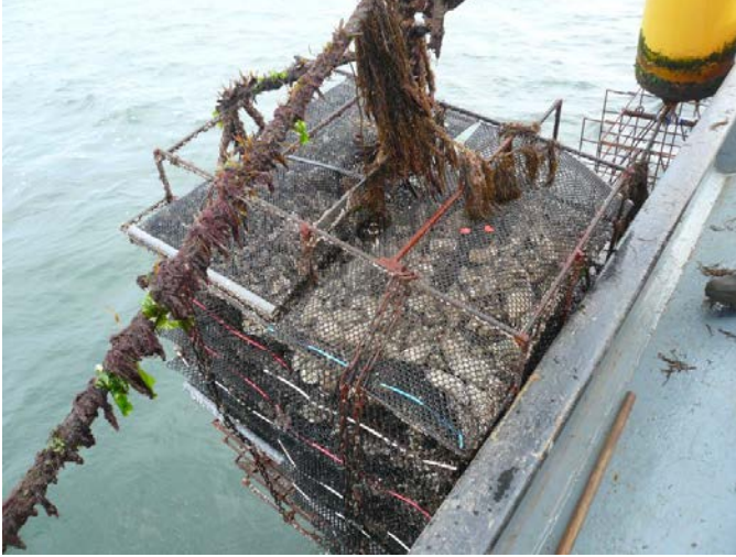
Fig. 4. Kooi met zakken voor off-bottom cultuur van oesters.

oogst een verwachte massa van 14 kg oesters. Per perceel zal 1 longline en 2 rijen met duo kooien op het diepste deel van het perceel worden geplaatst. Het benut oppervlak per longline is 4.800 m 2 en per rij van 100-duo kooien is dat 1.000 m 2 . In totaal wordt ernaar verwachting een voorraad gekweekt van maximaal 381.000 kg (300 duo-kooien met totaal 12.000 zakken, 300 duo-kooien met totaal 12.000 mandjes en 3 longlines met totaal 4.500 mandjes, dat is totaal 381.000 kg bij oogst). Deze teelt vervangt de teelt op de bodempercelen. Bij gebruik als bodemperceel hadden de percelen een voorraad van maximaal 144.000 kg bevat. De extra aanwezige biomassa is dus lokaal 237.000 kg meer. Ten opzichte van een totale geschatte voorraad op de percelen van 10 mln kg is dat 2,4 %.