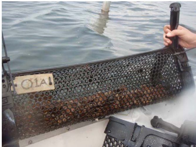
Fig. 5. Mandje voor off-bottom cultuur van oesters.