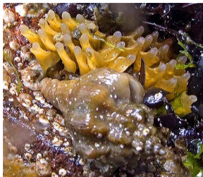
Fig 1. Ocenebra inornata. Rechts: ei capsules en slak.