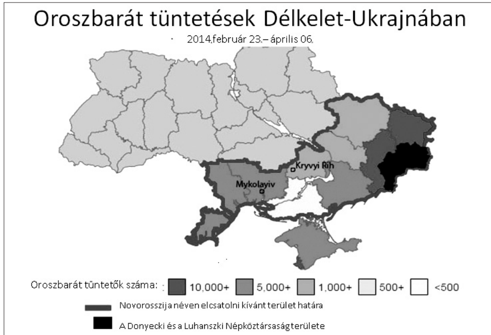
1. ábra. Oroszbarát tüntetések Délkelet-Ukrajnában 10

nyelvi törvény ellen is tüntettek, szerették volna, hogy az orosz is hivatalos nyelv legyen. Az oroszországi támogatással szervezett és végrehajtott tüntetések erőszakossá váltak. A megmozdulások az ország délkeleti térségeire terjedtek ki (l. 1. ábra).