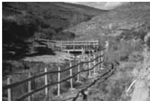
Fig. 4. Vista general del yacimiento de Serrantes

las conocemos) semejante al compsognátido Sino-sauropteryx , encontrado en China en yacimientos de edad similar a los de Soria.