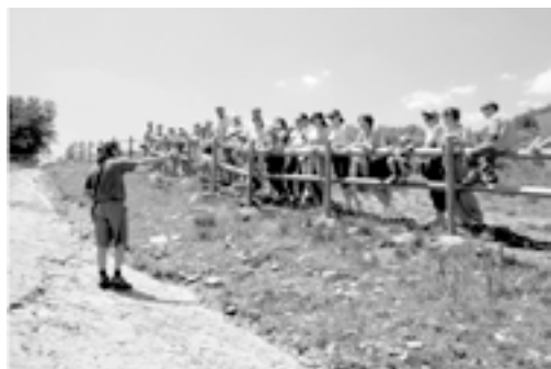
Fig. 3. Visita guiada al yacimiento de El Frontal (Bretún)