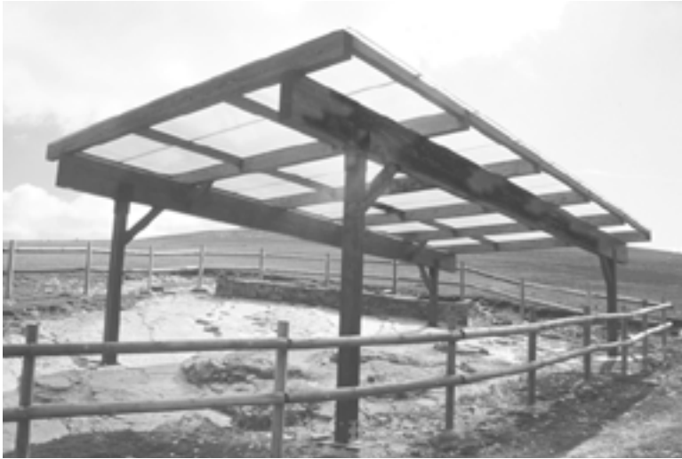
Fig. 1. Vista general del yacimiento de El Salgar de Sillas en Los Campos (Las Aldehuelas, Soria)

de 100 cm. de longitud. El hallazgo más reciente corresponde al contramolde (relleno de la pisada real) de una mano y un pie de un estegosaurido, un grupo de dinosaurios herbívoros caracterizados por la presencia de placas y espinas en su piel. Se trata de unas