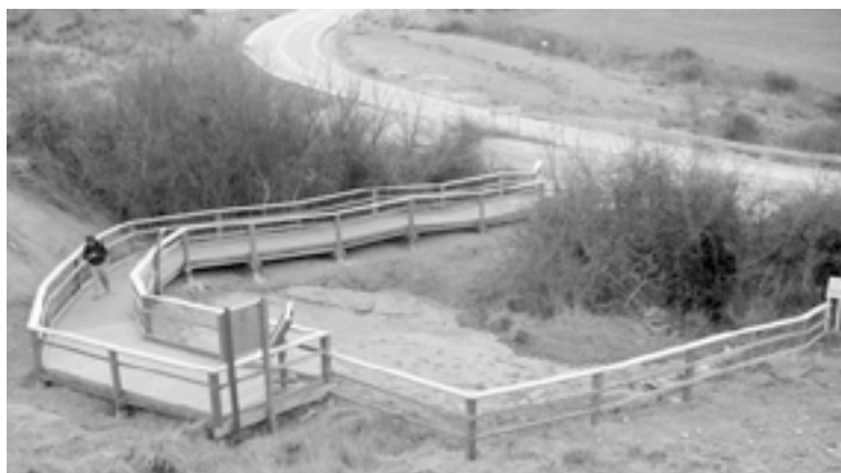
Fig. 6. Aspecto del yacimiento de Fuentesalvo

un producto de calidad y percibe que ha merecido la pena la inversión económica realizada. Es por ello que el turismo de interior puede ganar terreno frente a los grandes viajes al extranjero y convertirse en una oportunidad para las zonas y territorios que gestionen y promocionen su patrimonio natural y cultural. Pero para atraer a los visitantes es necesario difundir adecuadamente el proyecto, y cuando vengán estar preparados para impresionarlos. Si lo hacemos, volverán y volverán sus conocidos. Si les desilusionamos, no.