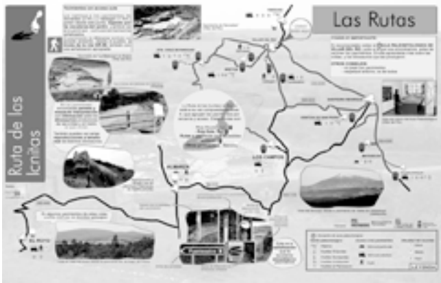
Fig. 5. Panel en el que se indica la ubicación de los yacimientos de la Ruta de las Icnitas

patrimonio natural y cultural de la comarca.