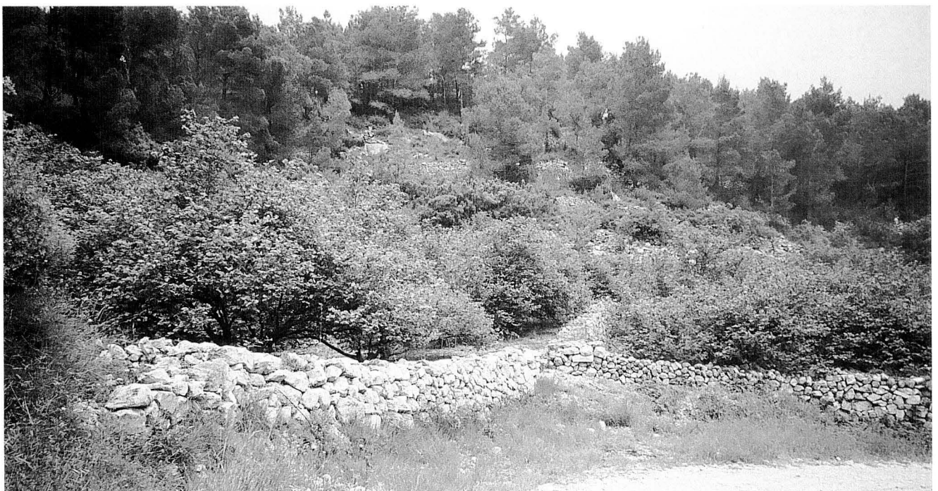
Agroecologia, autor F. Xavier Cabré LLauradó

L'agricultura ecològica és un sistema agrari que té com objectius una agricultura ambientalment sana i socialment justa, aconseguint l'obtenció d'aliments de la màxima qualitat, seguint els cicles naturals, excloent l'aplicació de productes químics de síntesis i basant-se en el coneixement tradicional, junt als nous coneixements científics i socioeconòmics. Aquest model agrari apareix com alguna cosa més que l'aplicació d'unes normes tècniques de cultiu. Podríem dir que es sosté en tres pilars bàsics: les persones (pagès i societat), la naturalesa (ecosistema agrari i el medi que l'en-