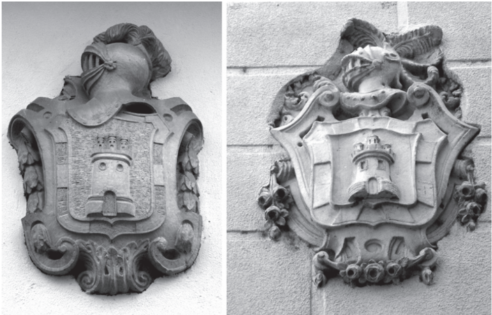
Fig. 2. Comparació dels escuts d'Antoni i Felip Castellví Ambrós