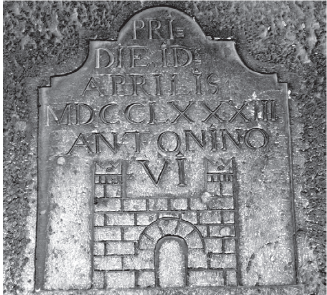
Fig. 1. Gravat d'Antonino Castellví, abril 1783, avui molí d'Oliflix, també conegut pel molí de butxaquina, amb un curiós jeroglífic, amb la inscripció "PRIE DIE ID APRILIS MDCCCLXXXIII ANTONINO VI" i la representació d'un castell amb dues torres laterals