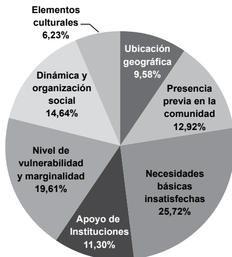
Gráfico 4. Ponderación para cada uno de los criterios