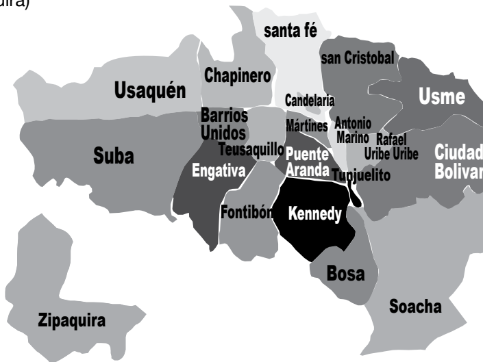
Gráfico 3. Mapa de diecinueve localidades de Bogotá y dos municipios (Soacha y Zipaquirá)

En el marco de este proyecto se recolectó información de diecinueve localidades de Bogotá (Antonio Nariño, Barrios Unidos, Bosa, Candelaria, Chapinero, Ciudad Bolívar, Engativá, Fontibón, Kennedy, Mártires, Puente Aranda, Rafael Uribe, San Cristóbal, Santafé, Suba, Teusaquillo, Tunjuelito, Usaquén y Usme) y dos municipios de Cundinamarca cercanos a Bogotá (Soacha y Zipaquirá) (ver Gráfico 3). Estas alternativas se pre-seleccionaron a partir de las