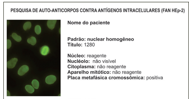
Figura 2 – Exemplo de laudo descritivo conforme as recomendações do IV consenso, apresentando-se como primeira informação a definição do padrão.

O IV Consenso manteve a apresentação do resultado de forma descritiva, mas sugeriu que o laudo seja apresentado na parte superior do resultado, facilitando a apresentação para o Reumatologista (fig. 2). Recomendou-se que o laudo continue contemplando a reatividade (fluorescente/não fluorescente