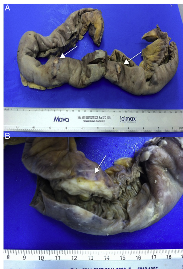
Figura 4 Segmento de yeyuno. A) Se observan lesiones blancas, nodulares (flechas). B) Acercamiento de una de las lesiones con bordes irregulares y extensión transmural (flecha).

En la literatura, el escenario clínico de obstrucción intestinal se define como la presentación más frecuente 4,5 , sin embargo, en otras revisiones, el dolor abdominal es el que se reporta como número uno 10 . Con la heterogeneidad de la definición de la variable del escenario clínico, es difícil