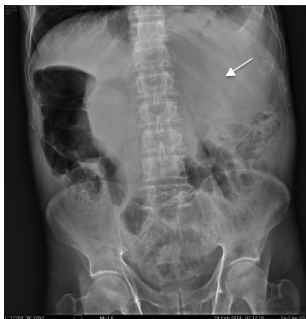
Figura 2 Radiografía simple de abdomen en decúbito. Se observa imagen en vidrio despolido localizada en hipocondrio izquierdo (flecha).

resección intestinal del segmento que contenía las 4 lesiones y entero-entero anastomosis latero-lateral manual en 2 planos. El reporte histopatológico concluyó: segmento de intestino delgado de 60 × 3 cm, la serosa con una solución de continuidad de 2 cm localizada a 1.2 cm del límite quirúrgico mayor y 4 lesiones blancas nodulares y placas blanco verdosas adheridas a la superficie; al corte, se localizaron 4 lesiones ulceradas, la mayor de 2.5 cm de diámetro, blancas y de bordes irregulares. Se diagnosticó carcinoma mucoepidermoide de alto grado en intestino delgado y mesenterio