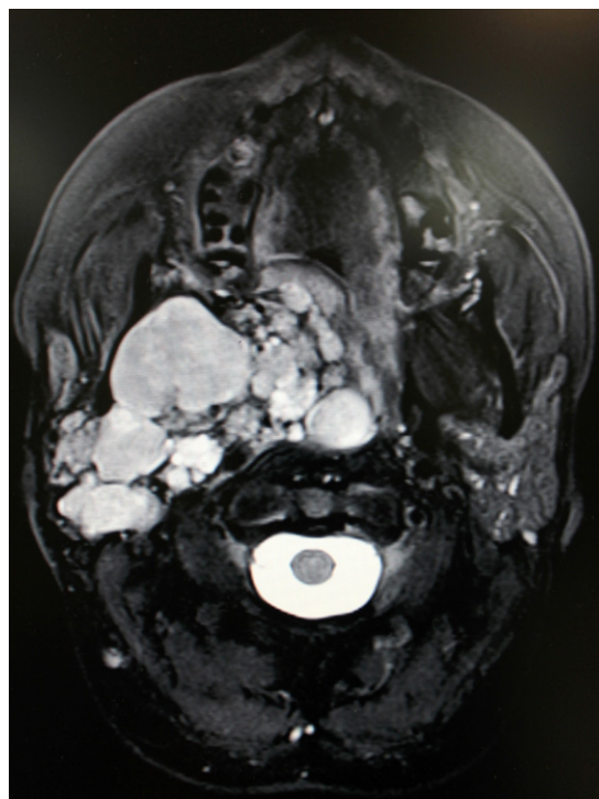
Figura 1 – RM preoperatoria (corte axial).

Se decide completar el estudio de extensión con una resonancia magnética (RM) (figs. 1 and 2) en la que se aprecia una gran lesión expansiva tumoral polilobulada localizada en el espacio parafaríngeo derecho, que se extiende al espacio masticador y oro-nasofaríngeo del mismo lado, condicionando un desplazamiento anterior de las superficies mucosas faríngeas con obliteración de las coanas y estenotando la luz faríngea. Se aprecia una desviación de la arteria carótida interna que se encuentra englobada por la tumoración y además una