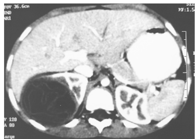
Figure 1 TDM abdominale en coupe axiale avec injection de PDC : masse kystique à paroi propre du pôle supérieur du rein droit avec enroulement de membrane en rapport avec un kyste hydatique type II.

L'échographie rénale pratiquée à 8 patients a montré, en se basant sur la classification de Gharbi, que le KHR était type I (25%), type II (12%), type III (38%), type IV (25%), type V (0%). Le KHR était unique et unilatéral dans 8 cas /8 et il siégeait le plus souvent à gauche (5 cas/8).