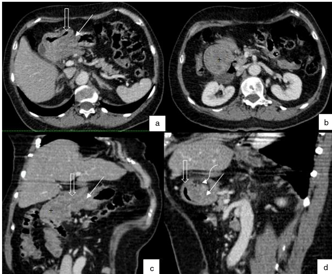
Figura 1 a, b) Cortes axiales de tomografía computada, en donde la pared gástrica (flecha sólida) se invagina dentro del duodeno (flecha vacía), con masa (+) como punto guía que es redondeada y presenta áreas centrales hipodensas que sugieren necrosis o áreas quísticas. c, d) Reformateos curvos de tomografía computada con masa gástrica dentro de luz duodenal (+) como punto guía para invaginación del estómago (flecha sólida) en el duodeno (flecha vacía), con anillo de tejido graso concéntrico (flecha curva) entre intususcepto e intussusciens .