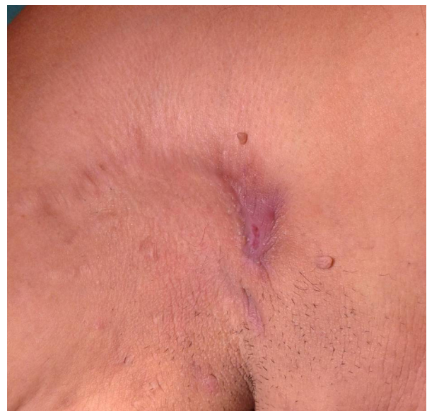
Figura 1 Hidrosadenitis supurativa en región axilar derecha.

Tras 4 meses de la primera intervención, el paciente volvió a presentar nuevos episodios de supuración e inflamación, por lo que se decidió nueva extirpación quirúrgica.