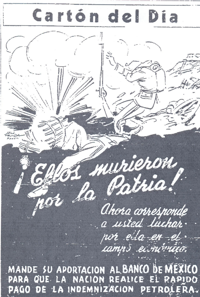
Figura 1. ¡Ellos murieron por la patria! El Nacional , 2 de abril de 1938, segunda sección, p. 1.

para una nación) y nuevamente se vinculaba la expropiación con el mito fundacional de la Independencia nacional. Se incluyeron las fechas 1810 y 1938; la primera identificada como el momento en que se alcanzó la «liberación política», mientras que la segunda significaba la «liberación económica» (fig. 2).