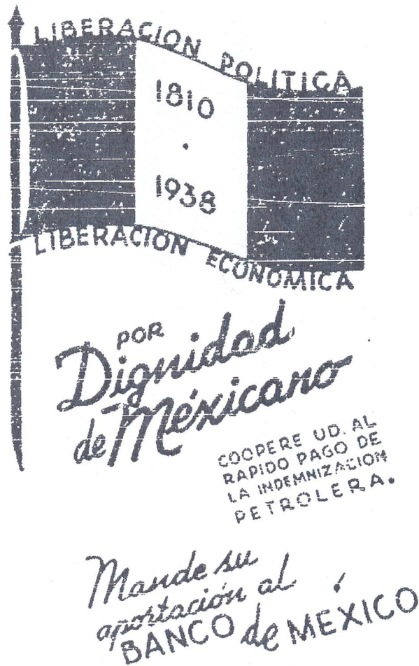
Figura 2. Liberación política - Liberación económica. El Nacional , 6 de abril de 1938, segunda sección, p. 2.

Para tal tarea, el Departamento de Educación Física aportó 5.000 muchachas que recorrerían las calles de la ciudad en búsqueda de aportaciones. Para remarcar el sentido patriótico de la labor, vestirían listones tricolores, marcharían con banda de guerra y una bandera. También se estipuló que montarían guardia en la Columna («el ángel») de Independencia 50 . Así, se reiteraba el mensaje de que la expropiación petrolera era salvaguarda de la Independencia nacional —en su aspecto económico—.