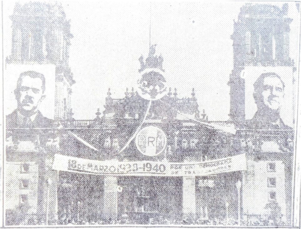
Figura 3. 18 de marzo 1938-1940. El Nacional , 18 de marzo de 1940, segunda sección, p. 1.

También es importante destacar la relevancia que tuvieron las manifestaciones públicas que desde 1938 promovieron las instituciones oficiales para expresar adhesión a la política petrolera. Estas marchas revelan algo más que solo contingentes de personas ocupando vialidades. En el recorrido de una manifestación se eligen las calles, monumentos, plazas y demás espacios donde se representa el poder del Estado y se reproduce la sociedad «oficial»; con ello se espera obtener el mayor provecho del simbolismo que guarda cada uno de los lugares por los que se transita 96 . No es fortuito que estas marchas recorrieran importantes avenidas y monumentos y llegaran a su apogeo en un emblemático «escenario» que reunía a las máximas expresiones arquitectónicas de los poderes político y eclesiástico del país (el zócalo, junto a la catedral metropolitana y frente al palacio nacional, sede del gobierno federal). Eran una especie de «actuaciones» colectivas que mostraban júbilo y apoyo al presidente por la determinación tomada 97 . Así, la expropiación aparecía como el fiel cumplimiento de una aspiración de la nación.