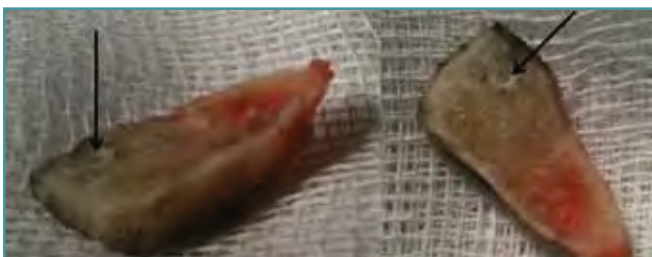
Figura 3. Dos imágenes del bloque óseo removido con el trozo de tornillo en él (marcado con flecha).

Figure 2. Diagram of the two proposals for cutting the triple Weil reosteotomy with nonremovable screw: Alternative A: Make the first cut (through the screw) and the third cut. Alternative B: make the three classic cuts of the triple Weil: the first cut through the screw, the second cut including in the dorsal fragment part of the screw, and the third cut, parallel to the first one, removing a piece of the bone.