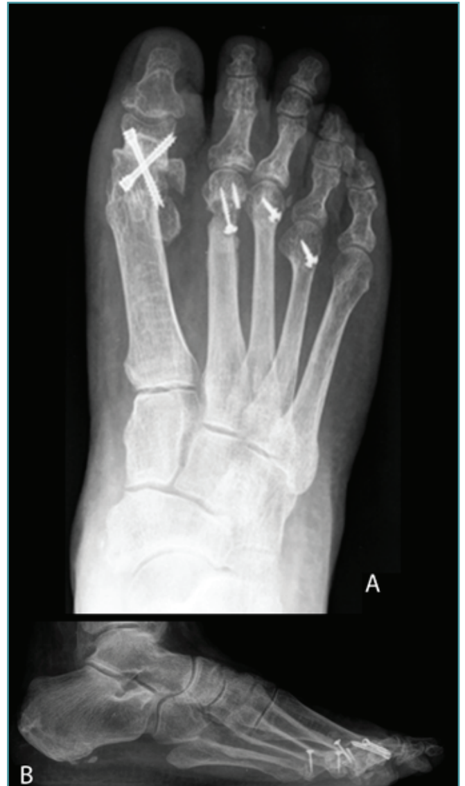
Figura 5. Radiografías posquirúrgicas: A: anteroposterior; B: lateral.

En múltiples ocasiones, y debido a que corresponden a cirugías de revisión, nos enfrentamos a la dificultad