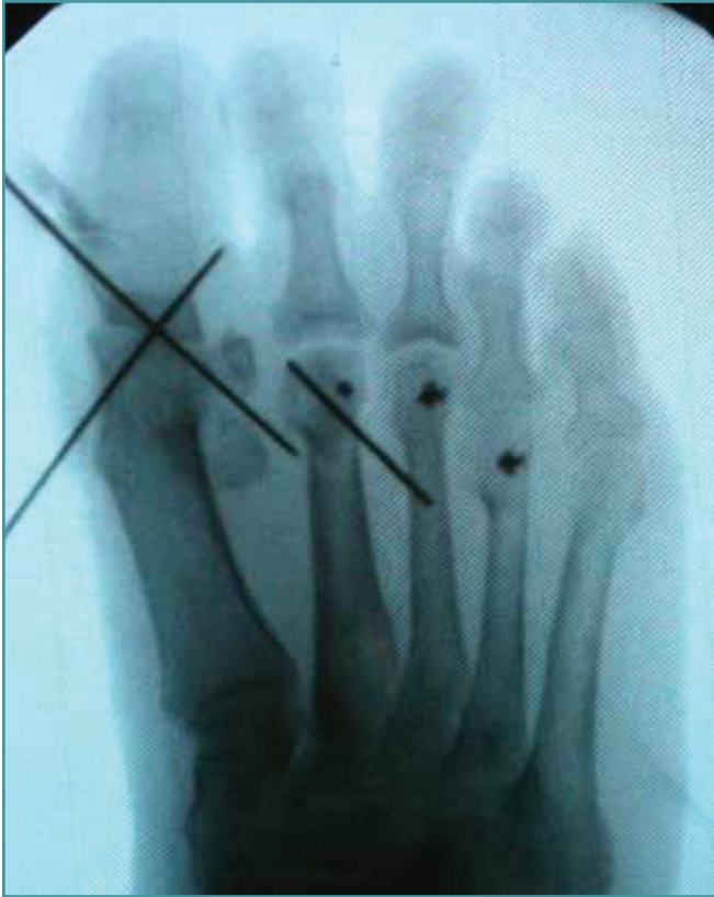
Figura 4. Radioscopia intraoperatoria con la fijación temporal con aguja de Kirschner.

Figure 4. Intraoperative fluoroscopy with the temporary fixation with Kirschner wire.