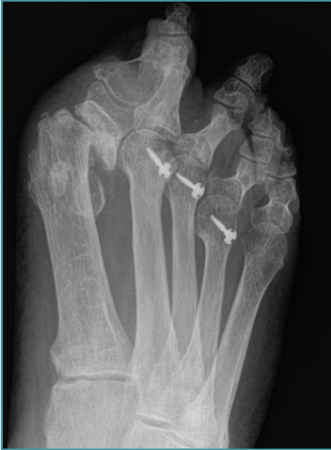
Figura 1. Radiografía anteroposterior preoperatoria. Figure 1. Anteroposterior preoperative radiograph.

del tornillo en el hueso a remover. Este tipo técnico es especialmente útil en casos en los que es necesario realizar una triple osteotomía de Weil en un paciente con una recidiva de metatarsalgia de 3. er rocker con material de osteosíntesis o restos del mismo (p. ej., pérdida de la cabeza del tornillo o rotura de la cabeza), sin indicación de alineamiento metatarsal.