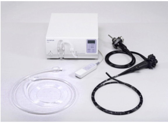
Figura 1 Videoendoscopio Olympus SIF-Q180.

unidad de endoscopia. Cada participante elegible fue asignado al azar a uno de los dos grupos de tratamiento ( \text{CO}_2 o insuflación de aire) como parte del protocolo de trabajo una vez adquirida la bomba de insuflación \text{CO}_2 UCR en nuestra unidad endoscópica