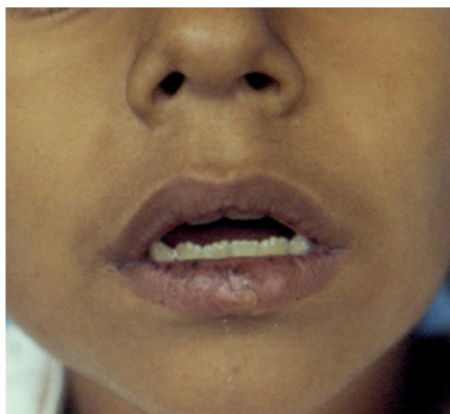
Figura 1 Máculas hipercrómicas en los labios.

labios, las cuales fueron aumentando en número y diámetro (fig. 1) y desde los 6 años de edad aparecieron manchas hipercrómicas de características similares en palmas y plantas. Las manchas en las plantas se encontraban en ambos pies y abarcaban además de la región de los ortejos, la región del metatarso y los talones (fig. 2). Los estudios de imagen y endoscópicos confirmaron la presencia de pólipos en el colon y en el intestino delgado (fig. 3); el estudio histopatológico de los mismos confirmó que correspondían al tipo hamartomatoso (fig. 4). El síndrome de Peutz-Jeghers se caracteriza