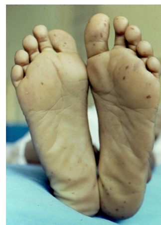
Figura 2 Lentigo plantar diseminado asociado con el síndrome de Peutz-Jeghers.

* Autor para correspondencia. Hospital Ángeles Lindavista, Río Bamba 639-330, 07760 Ciudad de México. Teléfono: 57-54-85-04 y 57-54-84-08.