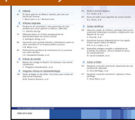
IMAGEN CLÍNICA EN GASTROENTEROLOGÍA