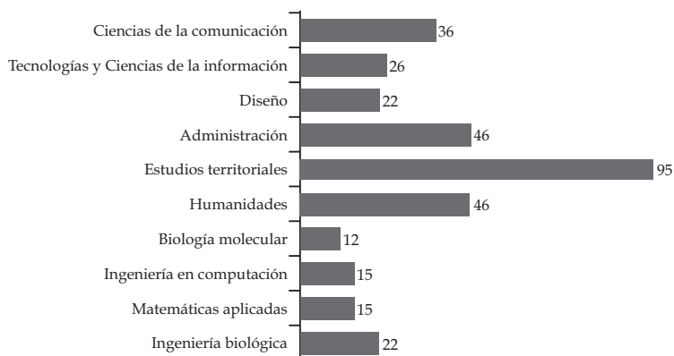
Gráfica 2 Total de temas relacionados directa o parcialmente con la sustentabilidad contenidos en los Planes de Estudio de la UAM-C