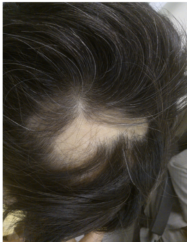
Figura 1 Fotografía de una paciente con parches de alopecia asociada al tratamiento de SRS.

No se detectó ninguna correlación entre la morbilidad y la dosis programada de radiocirugía o radioterapia estereotáctica fraccionada, el diagnóstico o el número de sesiones. Al evaluar la relación entre el uso de esteroides profilácticos y la morbilidad, se encontró una incidencia superior de morbilidad estadísticamente significativa ( p=0.03 ) en el grupo de pacientes que recibieron tratamiento esteroideo profiláctico frente a aquellos que no lo recibieron. La morbilidad general ( tabla 2 ) se consideró de grado 1 en el 74% de los casos y grado 2 en el 26%. Como morbilidad subaguda, 7 de 81 pacientes presentaron alopecia en parches que se documentó en promedio 4 semanas tras el tratamiento ( fig. 1 ).