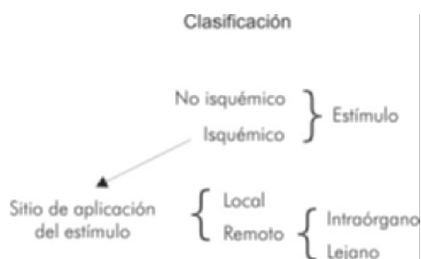
Figura 1. Clasificación del acondicionamiento según el tipo de estímulo y el sitio de aplicación.

De otra parte, están las ventanas de protección. Originalmente descrita, la respuesta inicial (ventana de protección) al estímulo de acondicionamiento es temprana (en minutos) y dura hasta dos a tres horas (4). Denominada clásica por algunos autores, es la respuesta más potente generada por la liberación de sustancias preformadas y modificación de proteínas existente. En 1993 se describió una segunda ventana de protección (tardía) con aparición a las 24 horas pero que dura hasta tres a cuatro días, y es generada por la modificación genética en la síntesis de diversas proteínas (21, 22).