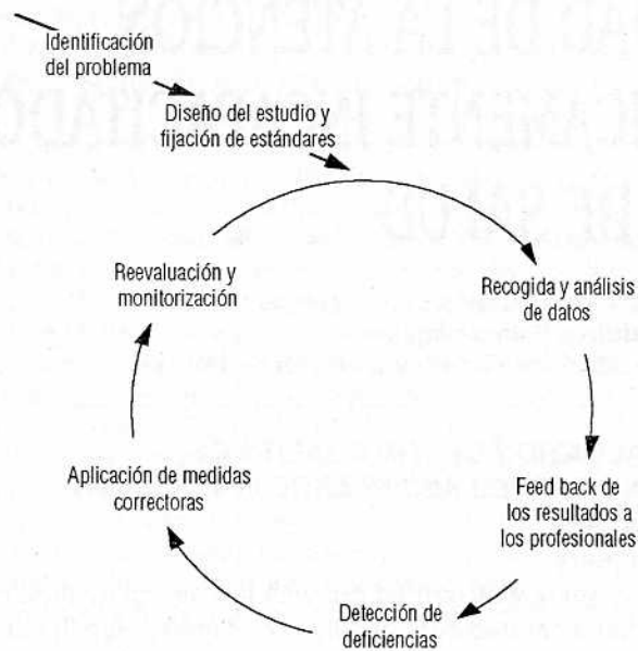
Figura 1. Ciclo de Garantía de Calidad (Palmer, 1989)

marcha de un programa de atención domiciliaria al paciente incapacitado, al considerarlo problema prioritario para la intervención.