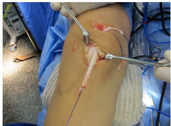
Figura 3 – Enxertos retirados dos tendões quadricipital e patelar por meio da técnica minimamente invasiva.

é então suturado a âncora previamente fixada do LPTM. O joelho é então posicionado em 30° de flexão, quando a patela se encontra na tróclea. O enxerto quadricipital é tracionado o suficiente para manter a patela reduzida. Com esse grau de tensão a patela deve ser capaz de ter uma excursão médio-lateral de 1 a 2 quadrantes, sendo importante que o enxerto não seja hipertensionado pelo motivo