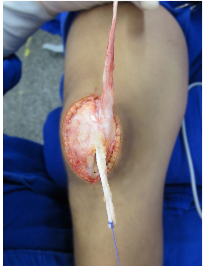
Figura 2 – Enxertos retirados dos tendões quadricipital e patelar por meio da técnica aberta.

é então suturado a âncora previamente fixada do LPTM. O joelho é então posicionado em 30° de flexão, quando a patela se encontra na tróclea. O enxerto quadricipital é tracionado o suficiente para manter a patela reduzida. Com esse grau de tensão a patela deve ser capaz de ter uma excursão médio-lateral de 1 a 2 quadrantes, sendo importante que o enxerto não seja hipertensionado pelo motivo