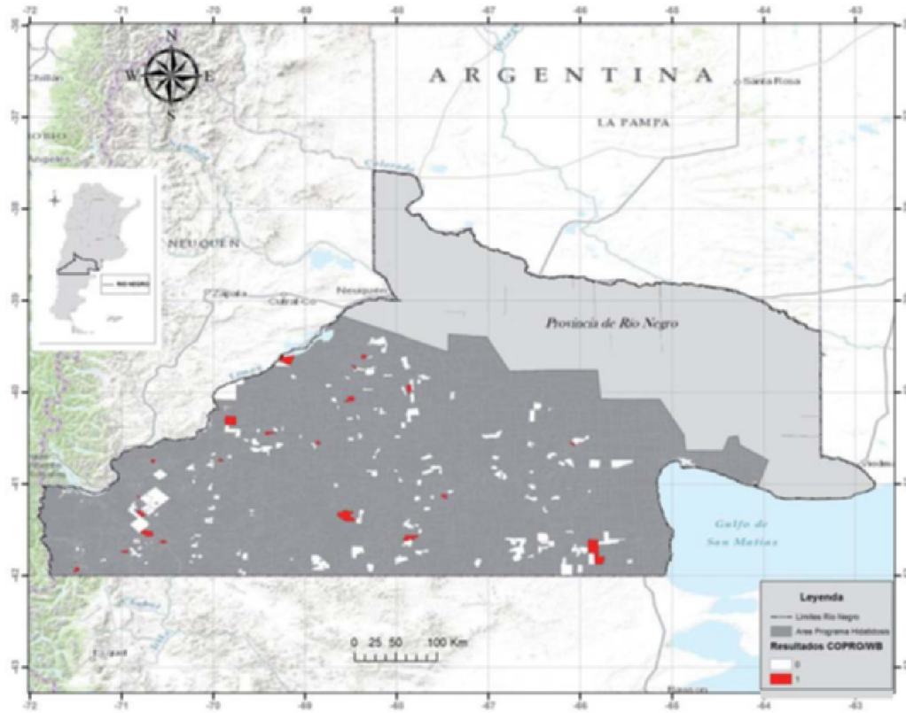
Figura 1 Distribución espacial de establecimientos ganaderos (UE) evaluados mediante detección de coproantígenos en materia fecal canina. Provincia de Río Negro, 2009-2010.