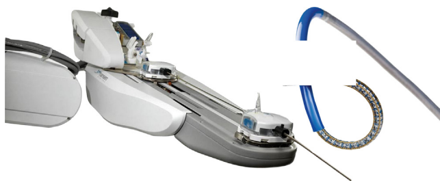
Figura 4 Sistema de mando a distancia con control tridimensional que permite el avance, retroceso, movimientos laterales y torsión del catéter de ablación.

varían ampliamente entre los centros y esto hace que los datos del registro sean una tarea ardua de comparar.