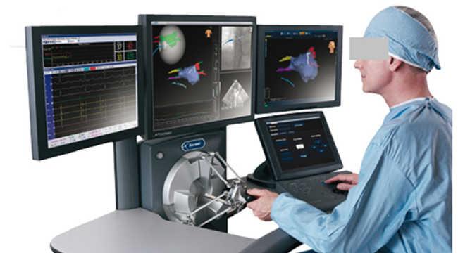
Figura 3 Control del brazo robótico del sistema Sensei ® y extremo distal del catéter Artisan ® Reproducción de Hansen ® Medical.

El catéter Artisan ® tiene dos segmentos controlados robóticamente que proporcionan hasta 270 grados de articulación curva, que ayuda en el acceso de sitios de anatomía difícil. Varios centros han reportado tasas de éxito aguda y a largo plazo, que concuerdan con los procedimientos manuales 11-13 . Dado que no existen ensayos controlados aleatorios terminados, que comparen la ablación robótica contra la ablación manual, emitir conclusiones sigue siendo difícil. Las técnicas, las tasas de complicaciones y los resultados clínicos de los procedimientos manuales y robóticos,