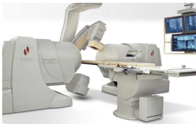
Figura 5 Sistema Niobe® II. Observe los grandes imanes al lado de la camilla.

Un catéter magnéticamente activado atraumático ( Biosense Webster Inc. , CA, EE.UU. o Biotronik , Berlín, Alemania) incorpora cuatro imanes en el segmento distal que permiten que el catéter sea manipulado a distancia por los campos magnéticos direccionales. El operador puede alterar el vector del campo magnético y la punta del catéter se alineará con el vector, de manera que el operador podrá navegar la punta distal del catéter. El SNM permite el almacenamiento de vectores magnéticos para el acceso repetido mientras el catéter magnético navega automáticamente. El avance y la retracción del catéter se controlan