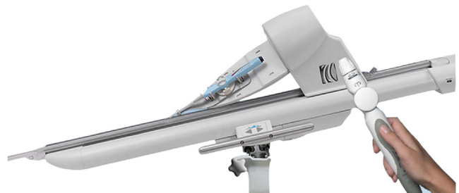
Figura 2 Sistema completo Amigo ® (Catheter Robotics).

Sensei ® (Hansen-Medical) (figs. 3 y 4): en 2010 recibió aprobación para iniciar ensayos clínicos y la exención como dispositivo de investigación.