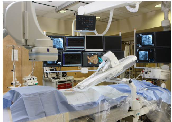
Figura 1 Disposición del sistema de navegación robótica en la sala de Electrofisiología.

Amigo ® (Catheter Robotics) (figs. 1 y 2): este es un dispositivo robótico de control de catéteres a distancia que consta de dos partes: sistema de catéter remoto y controlador remoto. Este sistema tiene una vaina robótica para dirigir los catéteres que se controlan en una estación de trabajo cercana, de manera similar al sistema Sensei ® . El primer uso de este sistema en humanos data de 2010, en Leicester, Reino Unido, donde se empleó para realizar una ablación de aleteo auricular. De un uso poco extendido, su aplicación en aislamiento de venas pulmonares es muy limitado aun y la experiencia clínica la constituyen reporte de casos 10 . Se esperan más estudios para confirmar su seguridad y eficacia.