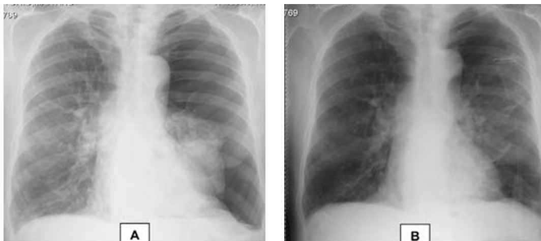
Fig. 1 – Telerradiografia torácica na admissão (A) e após colocação do dreno torácico (B)

Ao 9.º dia de internamento verificou-se novo agravamento clínico, com aumento da dispneia em repouso, dessaturação significativa e aumento marcado do enfisema subcu-