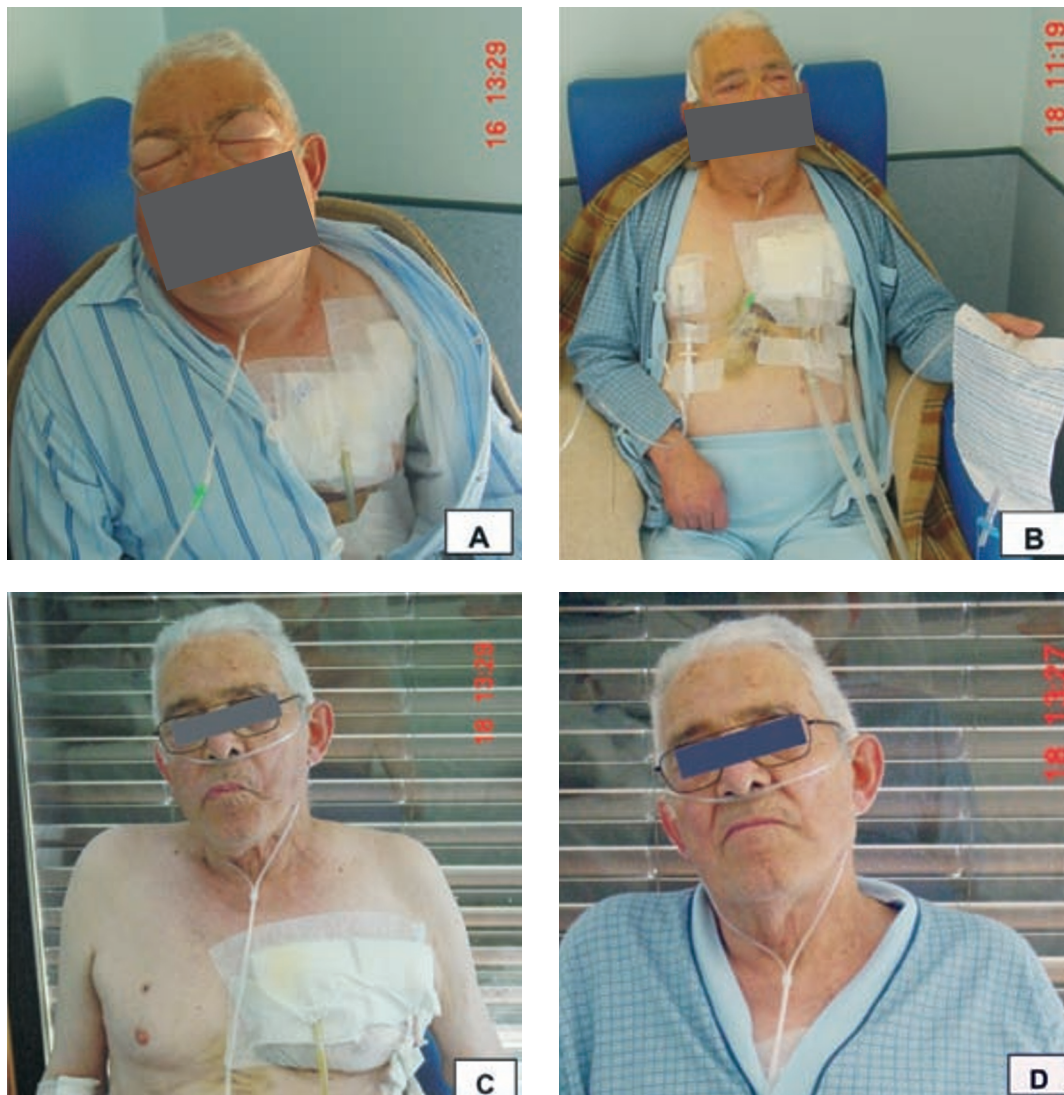
Fig. 5 – Aparência do doente, previamente à colocação de drenos subcutâneos (A); após colocação dos drenos subcutâneos (B); após retirada dos drenos subcutâneos, sem evidência de enfisema (C e D)

sicionados na região torácica anterior, sobre o 3.º espaço intercostal. Seguidamente, foram fixados à pele com seda 2/0 e adaptados sacos de drenagem. O ar foi recolhido nos sacos de drenagem, que tiveram de ser substituídos três vezes. Após a colocação dos drenos subcutâneos, verificou-se descompressão efectiva do enfisema subcutâneo,