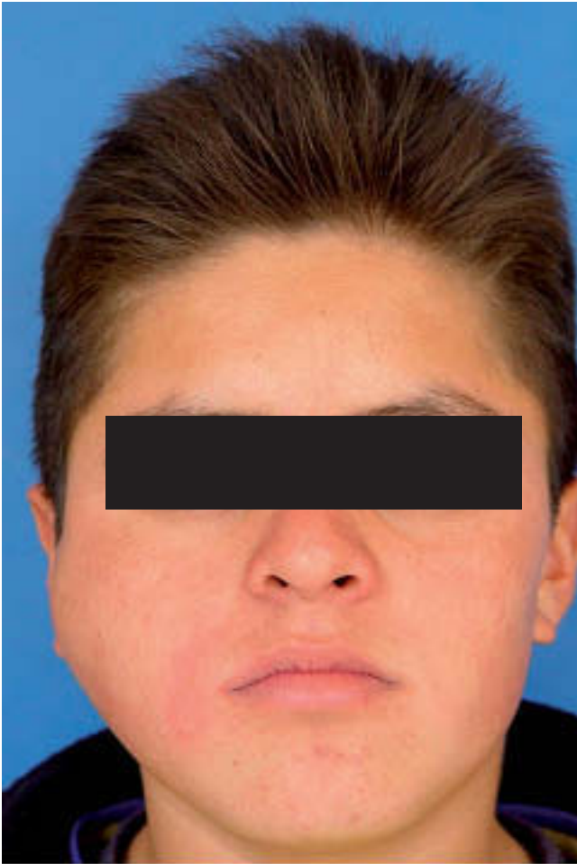
Figura 1 – Imagen inicial con aumento de volumen en el lado derecho de la cara.

El fibroma desmoplásico es un raro tumor miofibroblástico que comprende menos del 1% de los tumores óseos incluyendo neoplasias benignas 1 . Estas manifestaciones de fibromatosis agresivas fueron descritas por primera vez por Jaffe en 1958 2 , que encontró esta patología en diferentes huesos, como la tibia, la escápula o el fémur. El primer caso publicado de fibroma desmoplásico se atribuye a Griffith e Irby en 1965 3 , y desde esa fecha numerosos casos han sido publicados. El modo de tratamiento de esta patología es controvertido, al igual que sus variables, el seguimiento, que es complementado con el análisis clínico-patológico, y las características radiográficas 4 .