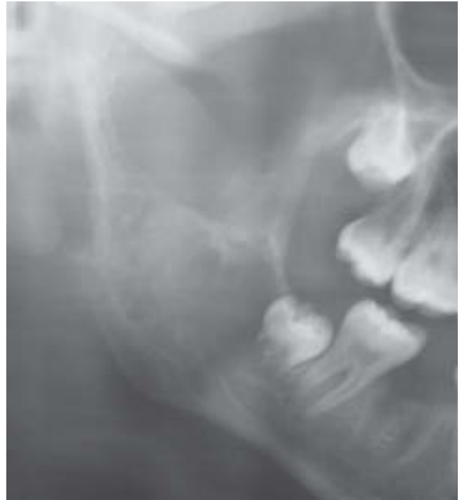
Figura 2 – Radiografía panorámica con proceso radiolúcido en rama mandibular.

En la revisión de la literatura de los 40 años previos al año 2002 existe el reporte de 74 casos, con predilección por mujeres frente a hombres. La neoplasia ocurre en un amplio rango de edad, extendiéndose de la primera a la sexta décadas de la vida con un 84% de pacientes jóvenes de 30 años de edad de promedio; la mayoría de los casos involucra la mandíbula, y el resto, los maxilares. Los signos y síntomas son también variados, en un 65% de casos se presenta asintomático, comenzando solo con un aumento de volumen. En alguno de los casos se presenta con dolor