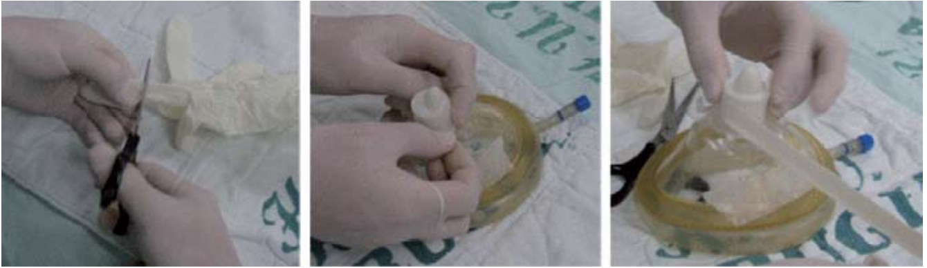
Fig. 3 – Construcción de la máscara de Lema-Tafur. El dedo de guante funciona como diafragma que permite el sellado del sistema y el paso de la fibra óptica y del tubo, a través de un orificio pequeño.