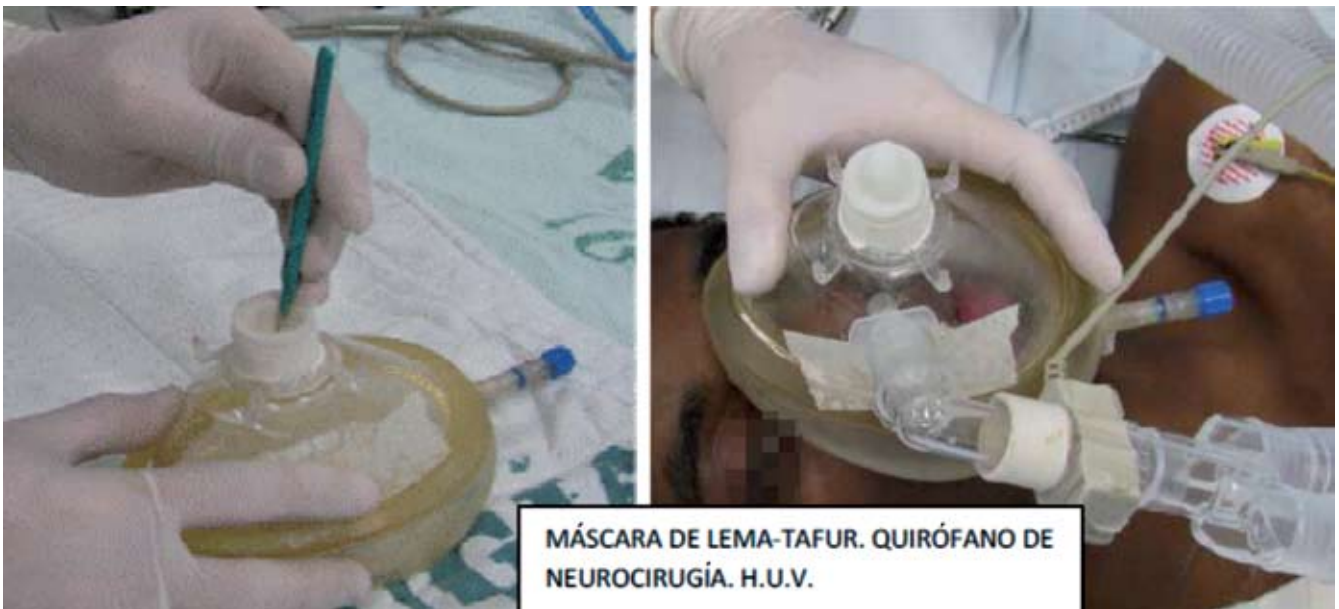
Fig. 4 – Construcción de la máscara de Lema-Tafur. El dedo de guante funciona como diafragma.