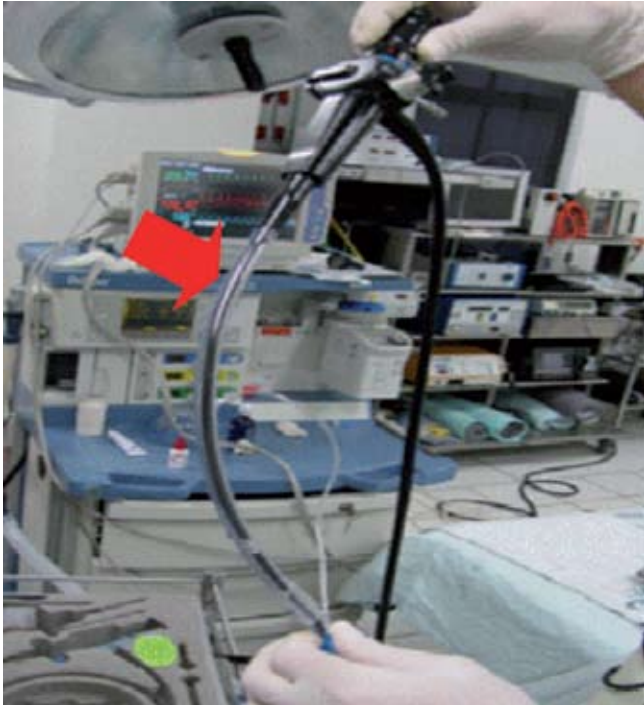
Fig. 6 – Ubicación del tubo en la fibra óptica antes del inicio del procedimiento. El conector del tubo se retira, dejándolo en un lugar seguro, para facilitar el paso por lo máscara.

g. La posición del operador del fibrobroncoscopio, en lo posible, debe ser a la cabecera del paciente.