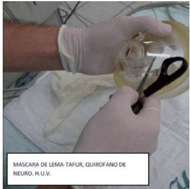
Fig. 2 – Construcción de la máscara de Lema-Tafur. Perforación de una máscara facial común con un objeto cortante. En este agujero se introducirá un conector de tubo traqueal.