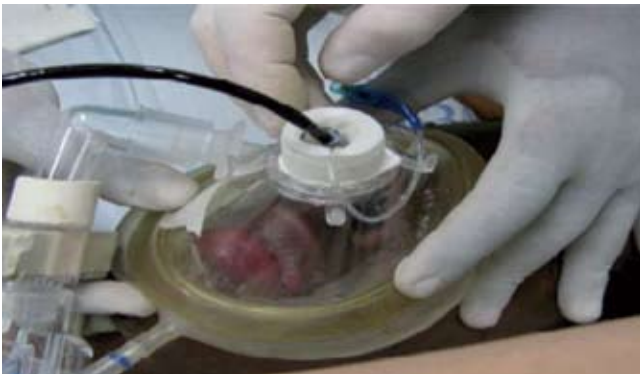
Fig. 8 – Descenso del tubo a través del máscara

Como en toda técnica, el seguimiento de una guía o un protocolo para la realización del procedimiento aportará a este una gran probabilidad de éxito, pues evitará la improvisación, independientemente de la experticia en la operación directa del fibrobroncoscopio.