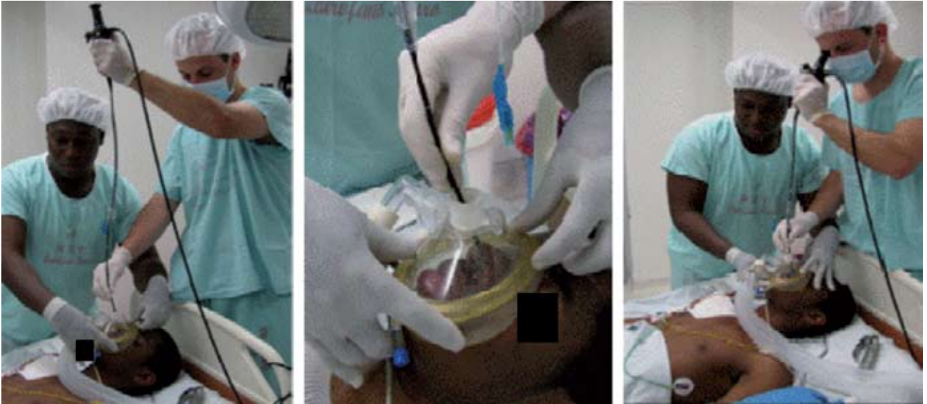
Fig. 7 – Introducción de la fibra óptica a través del puerto de trabajo.