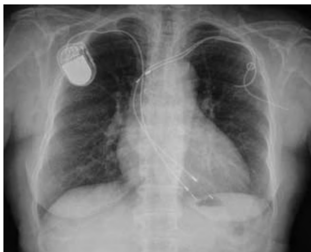
Figura 1. Radiografía simple de tórax donde se aprecia explante parcial de electrodos a nivel de la subclavia izquierda y un dispositivo completo a nivel derecho.

con antibióticos siguiendo dosis, duración del tratamiento y pautas variables, no siendo posible determinar la duración media del tratamiento antibiótico. En 15 pacientes (55,5%) se había procedido a la retirada del generador de marcapasos infectado, extracción parcial de los electrodos e implante de un nuevo dispositivo endovenoso contralateral (Fig. 1). En cinco enfermos (18,5%) se habían realizado plastias miocutáneas con el fin de cubrir el extremo distal exteriorizado de los electrodos de marcapasos. Un 78% de los casos presentaba criterios diagnósticos de endocarditis definitiva y un