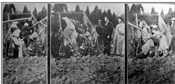
Figura 1. Fosa común, Cementerio Bogotá. La carreta macabra.

Igualmente, los informes oficiales hablan de una “triste insipiente de nuestra higiene pública merced a la cual pueden reputarse como un milagro la existencia normal de la ciudad, con sus calles llenas de lodo o de polvo (...) y sobre todo esto, la miseria y el supremo desaseo en que viven las clases bajas del obrerismo” (30) (figura 1).